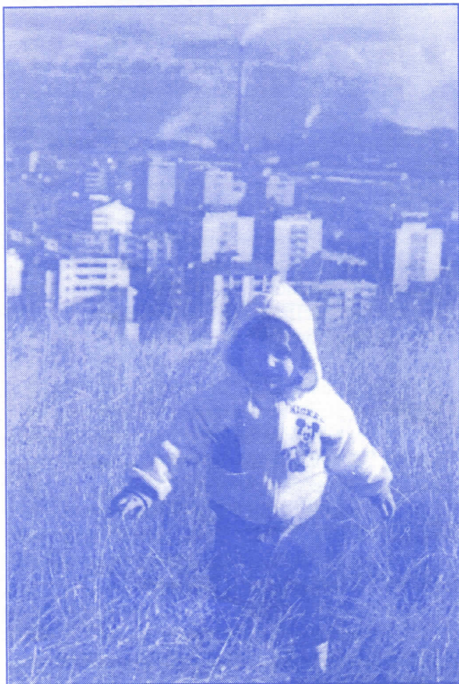
Грађани Бора, заслужујете боље услове живота за вас и вашу децу

туризма. Овоме треба додати близину Дунава, у чијој околини су археолошка налазишта чувене Гамзиградске бање, што омогућава граду Бору да осим бабра понуди још много тога како домаћим, тако и иностраним гостима. И овај сегмент привреде може представљати солидну алтернативу и потенцијалну будућност развоја града и када бакар не буде више у жижи интересовања. Као привредна грана значајна за општину Бор туризам мора себи у условима тржишне привреде и потпуне приватизације да обезбеди изворну акумулативност. Из тог разлога залагаћемо се да се у општини Бор изврши приватизација туристичких објеката додељивањем концесија искључиво путем лиценцијације и приватизацијом приликом реконструкције туристичких објеката. Улога општине у обезбеђивању нормалног функционисања туризма биће искључиво у обезбеђивању услова за изградњу комуналне инфраструктуре и саобраћаја. На тај начин, пре свега изменом својинских односа, омогућиће се конкурентност укупне туристичке понуде општине Бор како у нашој земљи тако и у Европи и свету.