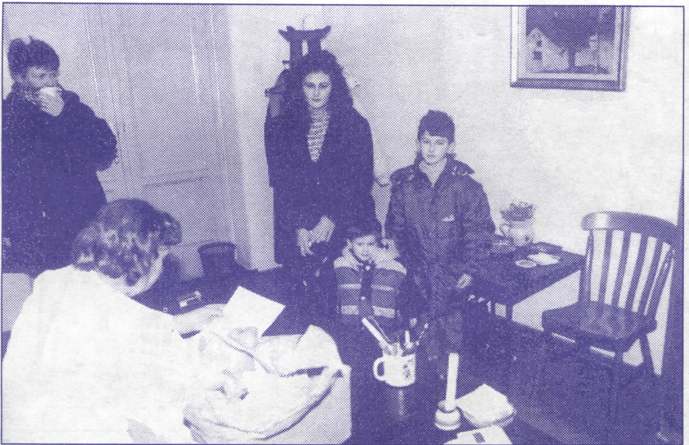
Српски радикали никада и никог не остављају на цедилу: помоћ деци палих бораца

Скадарлија, улица под заштитом, као део наше културне баштине, постепено се претвара у киоск плато и паркинг, јер су надлежни из градске управе потпуно незаинтересовани да је очувају у првобитном обележју. Последње интервенције на освежењу ове амбијенталне четврти урађене су пре више од деценије. Важно је напоменути да ДУП изгледа Скадарлије постоји, али је проблем што се никако не креће са његовом реализацијом.