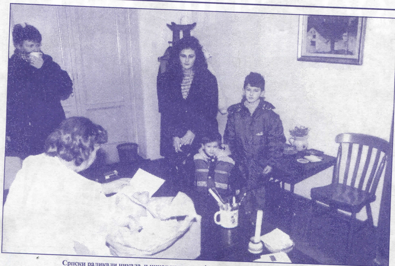
Српски радикали никада и никог не остављају на цедилу: помоћ деци палих бораца

Скадарлија, улица под заштитом, као део наше културне баштине, постепено се претвара у киоск плато и паркинг, јер су надлежни из градске управе потпуно незаинтересовани да је очувају у првобитном обележју. Последње интервенције на освежењу ове амбијенталне четврти урађене су пре више од деценије. Важно је напоменути да ДУП изгледа Скадарлије постоји, али је проблем што се никако не креће са његовом реализацијом.