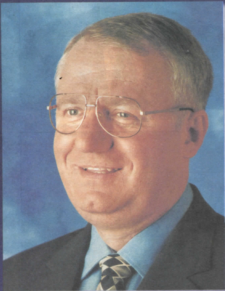
др ВОЈИСЛАВ ШЕШЕЉ ПРЕДСЕДНИК СРПСКЕ РАДИКАЛНЕ СТРАНКЕ