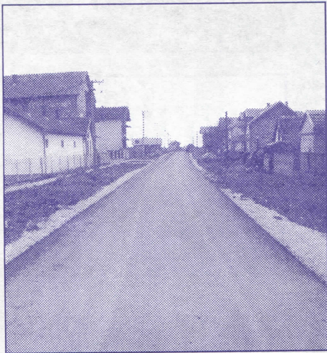
Брзо, ефикасно и квалитетно атрибути радикалске власти

– санираћемо Борску улицу око "Ц"-маркета и Вукасовићеву до броја 70,