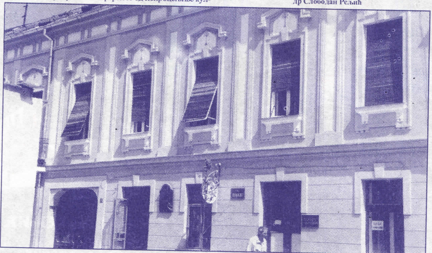
Старо језгро Земуна у новом руху