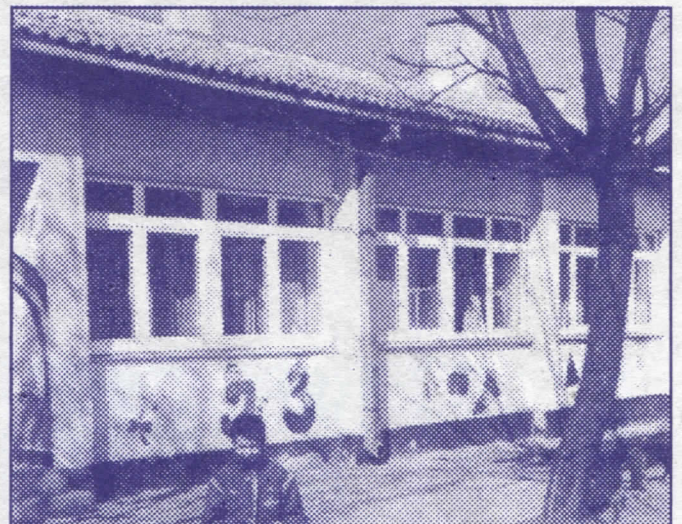
Брига о деци приоритет: српски радикали реновирали су све вртиће и Земуну

Активираћемо одговарајуће службе на хватању паса луталица, а власнике кућних љубимаца обавезати да поштују прописе о чувању и држању кућних љубимаца.