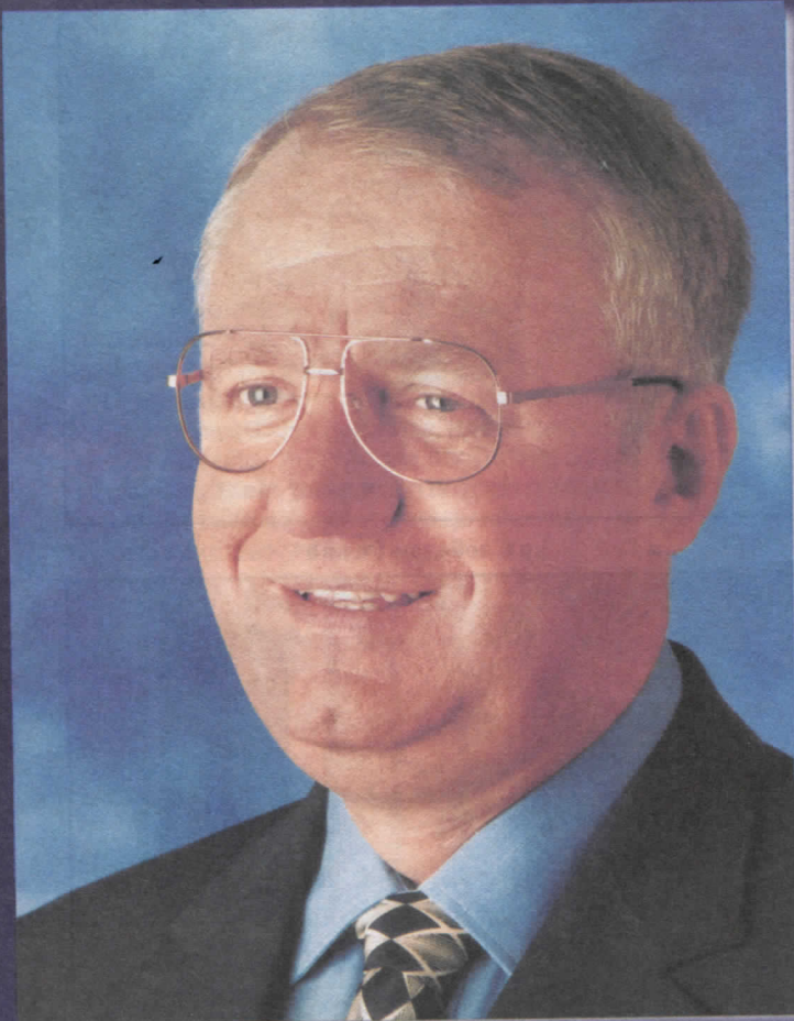
др ВОЈИСЛАВ ШЕШЕЉ ПРЕДСЕДНИК СРПСКЕ РАДИКАЛНЕ СТРАНКЕ