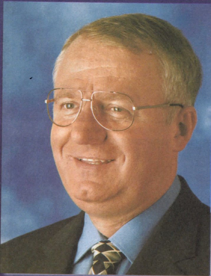
др ВОЈИСЛАВ ШЕШЕЉ ПРЕДСЕДНИК СРПСКЕ РАДИКАЛНЕ СТРАНКЕ