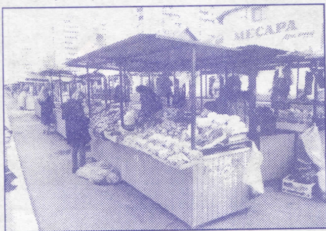
Према рецепту земунске, уредити све пијаце на територији Београда