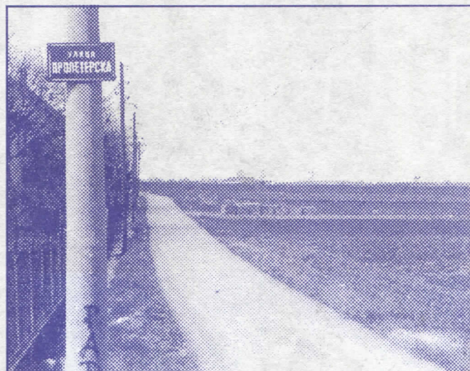
Километри асфалтираних путева у насељу Добановци

Уредићемо дечји парк на зеленој површини испред стамбених објеката Рудо 1, 2 и 3.