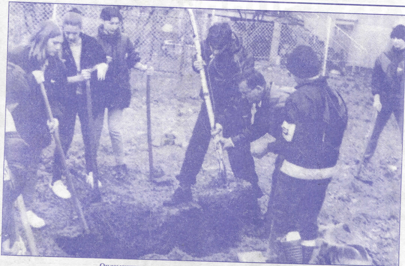
Оплеменили новим садницама запунгено градско земљиште

Време достојанственог Београда, када је и за данашње прилике, бенигно бацање опушака на земљу било својеврсни експес, неповратно је прошло, затрпано под налетом осиноности и глупости. Шта се у међувремену догодило? Пре свега, део српске опозиције окупљен око групације за отимачину, симболично названом коалиција "Заједно", после примопредаје власти, обећали су промене за које су се, какве ли ироније, борили. Међутим, не и промене за које су се они борили. Јер, требало је, увек изнова, изналазити нове изворе новца за раскалшан живот најужег круга људи, блиског породици Драшковић.