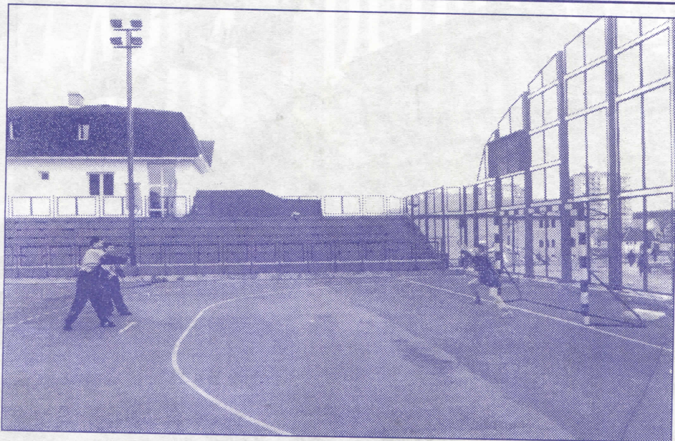
За безбрижну младост: реконструкција постојећих и изградња нових спортских објеката

Њихово владање престоницом свело се на обичну диктатуру једног одабраног круга људи, против које су се, колико јуче, декларативно борили. Уместо "реформи", продали су своје душе зарад новца, привилегија, путовања.