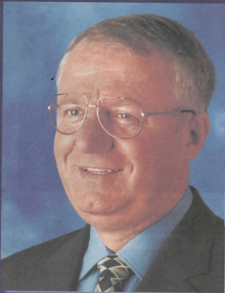
др ВОЈИСЛАВ ШЕШЕЉ ПРЕДСЕДНИК СРПСКЕ РАДИКАЛНЕ СТРАНКЕ