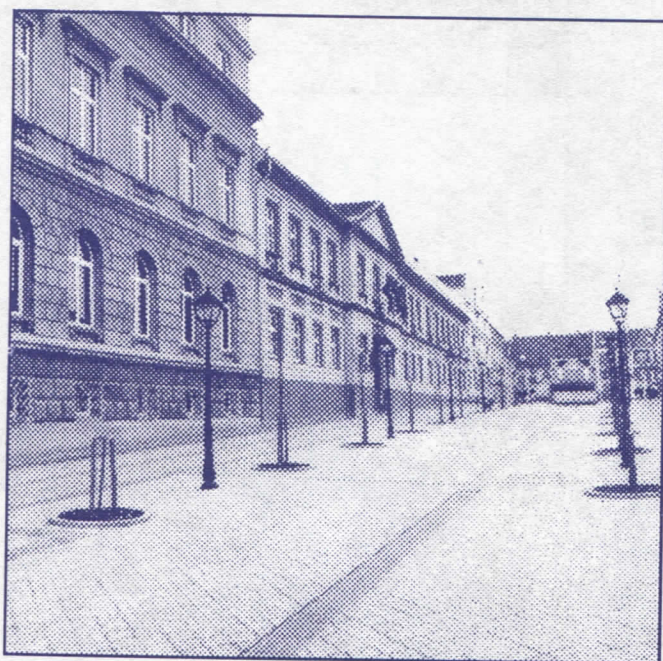
Трг победе – радикалски понос