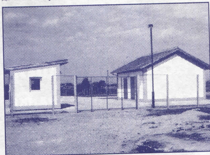
Општина Земун је обезбедила станицу за дохлорисавање у насељу Јаково