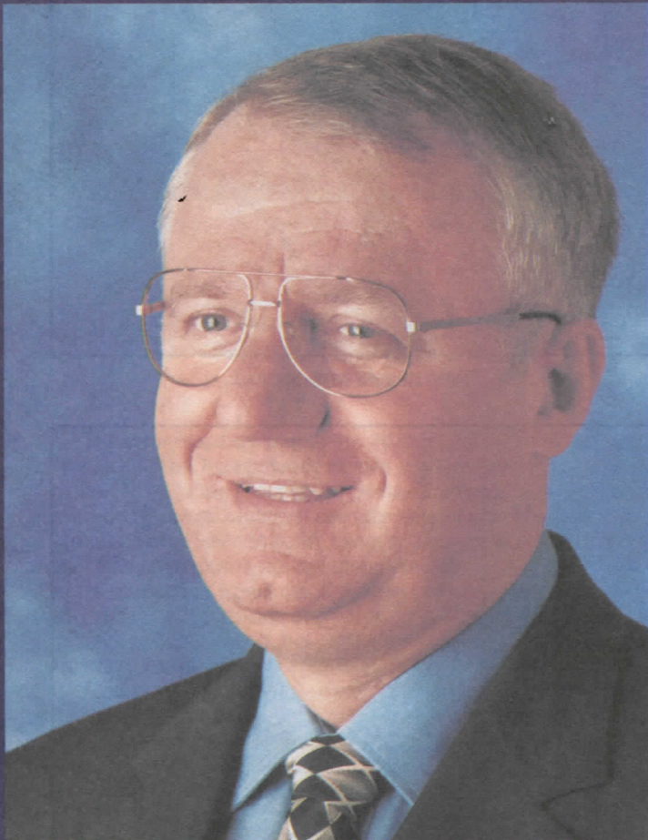
др ВОЈИСЛАВ ШЕШЕЉ ПРЕДСЕДНИК СРПСКЕ РАДИКАЛНЕ СТРАНКЕ