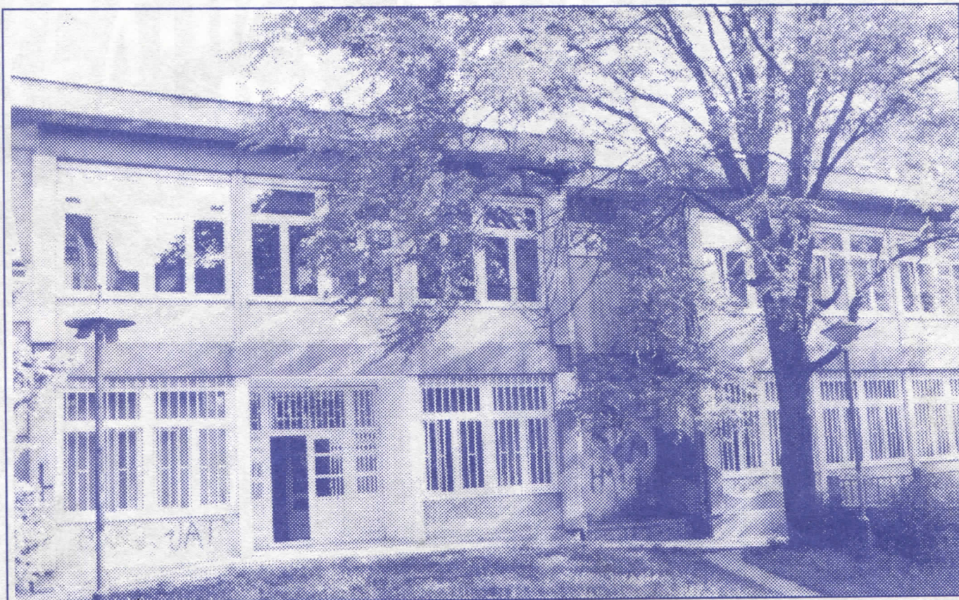
Брига о деци на првом месту: доградићемо и реновирати школе