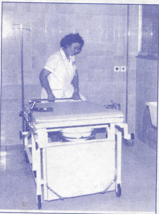
Здравље на првом месту: општина Земун је набавила неопходну медицинску опрему

– Санираћемо коловоз у улицама Војводе Добрњца, Ђуре Ђаковића од станице Дунав до станице Панчевачки мост, Руварчеву целом дужином, Стојана Новаковића,