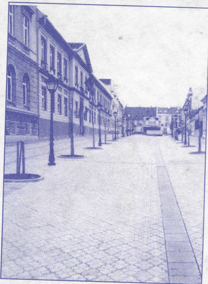
Трг победе српских радикала у Земуну

Међутим, сигурно је да сви надмени покушаји градских челника да ескивирају полагање рачуна јавности о пореклу енормног личног богаћења, неће уродити плодом. Такозвана општинска власт СПО-а на Палилули од сил-