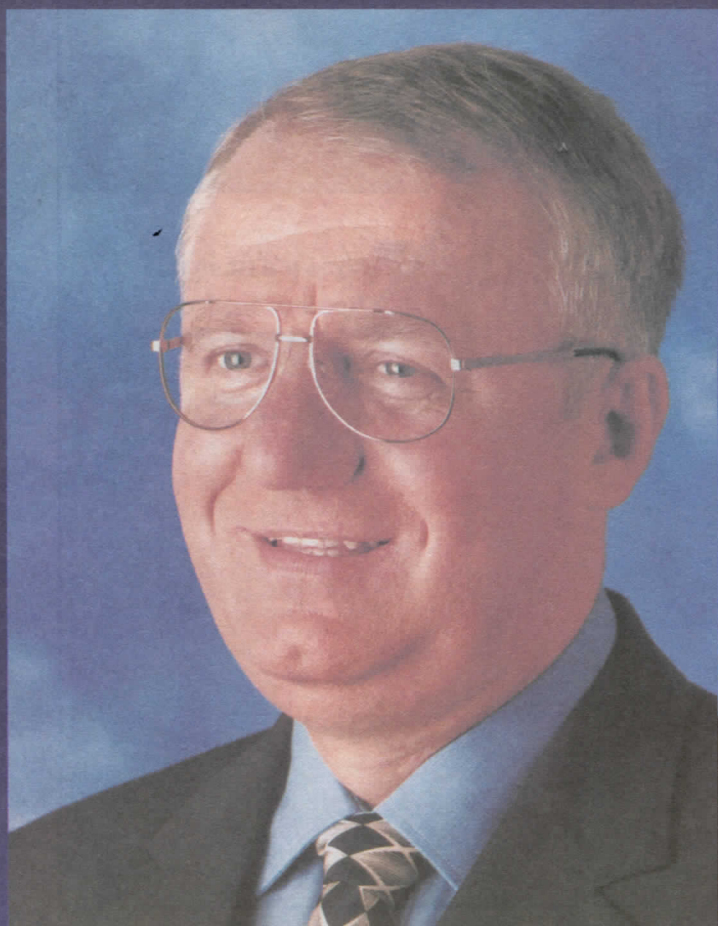
др ВОЈИСЛАВ ШЕШЕЉ ПРЕДСЕДНИК СРПСКЕ РАДИКАЛНЕ СТРАНКЕ