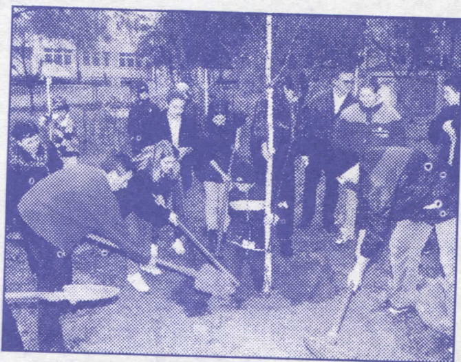
Акција оплемењивања животне средине

– Уклонићемо депонију песка и шљунка у насељу Бара Венеција и поставити адекватан број контејнера за смеће,