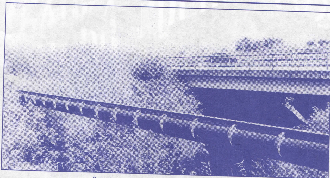
Реконструкција водоводних и канализационих мрежа

– изградићемо канализациону мрежу у деловима Сењака и Топчидерског брда.