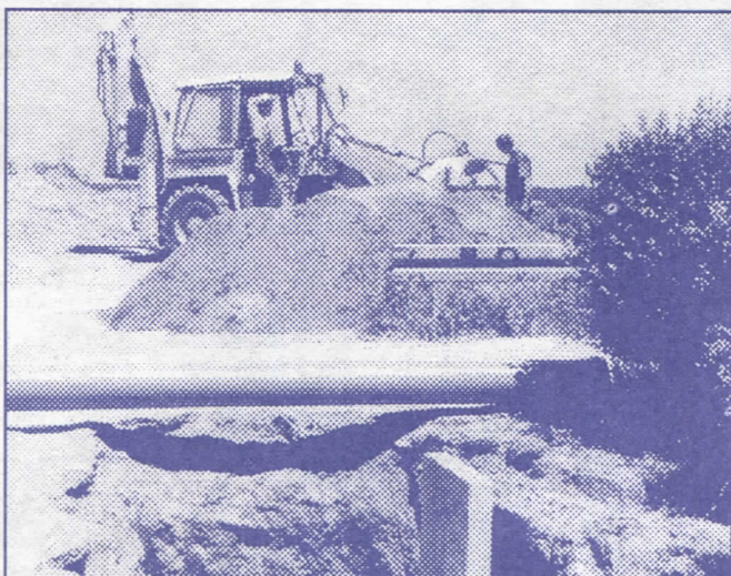
Изградња водоводне и канализационе мреже као приоритет српских радикала Чукарице