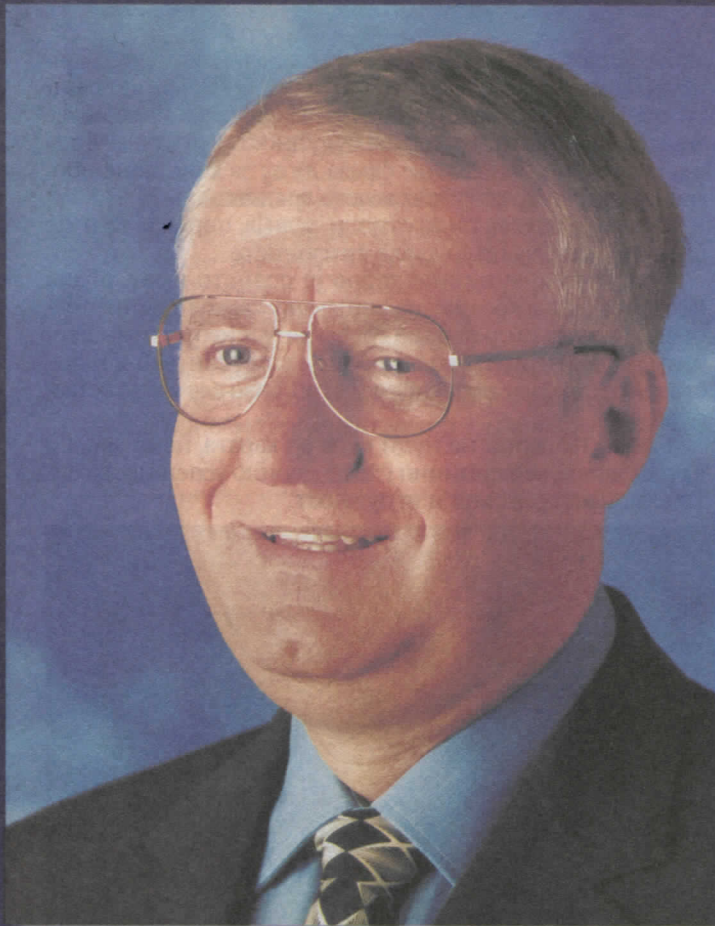
др ВОЈИСЛАВ ШЕШЕЉ ПРЕДСЕДНИК СРПСКЕ РАДИКАЛНЕ СТРАНКЕ