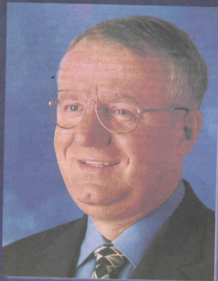
др ВОЈИСЛАВ ШЕШЕЉ ПРЕДСЕДНИК СРПСКЕ РАДИКАЛНЕ СТРАНКЕ