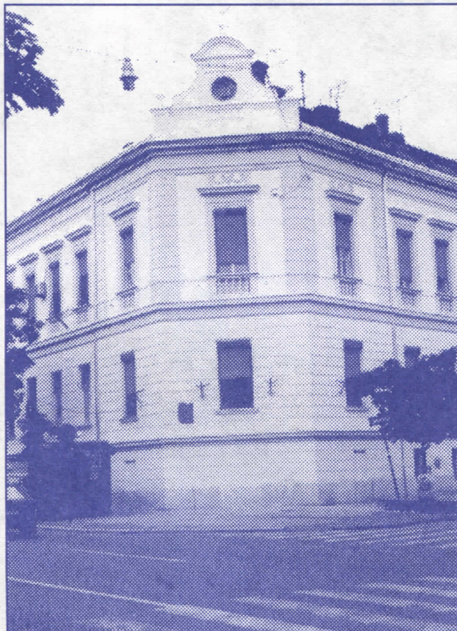
Враћање старог сјаја Земуну