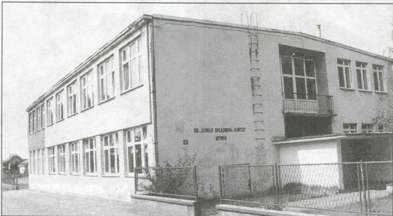
Комплетна адаптација школа