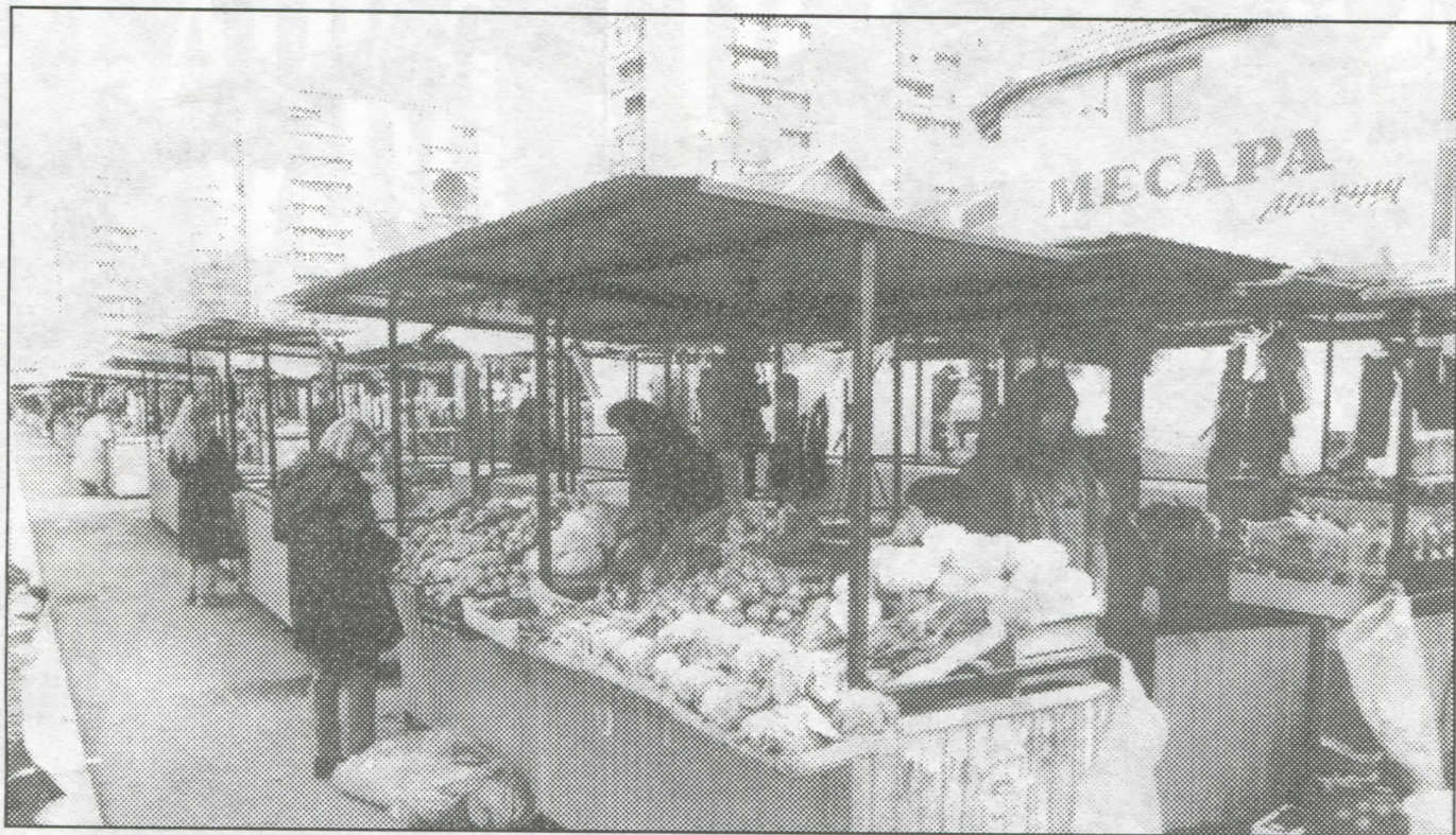
Изградња и одржавање пијаца