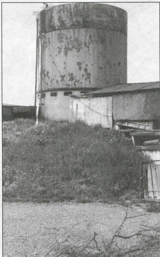
Црна станица у насељу Бечмен оспособљена доласком српских радикала на власт у Земуну

Спојићемо канализациону мрежу са топчидерским колектором, као и урадити секундарну водоводну мрежу за прикључак на изграђени регионални водовод Макиш-Младеновац у циљу повећања притиска у линијама.