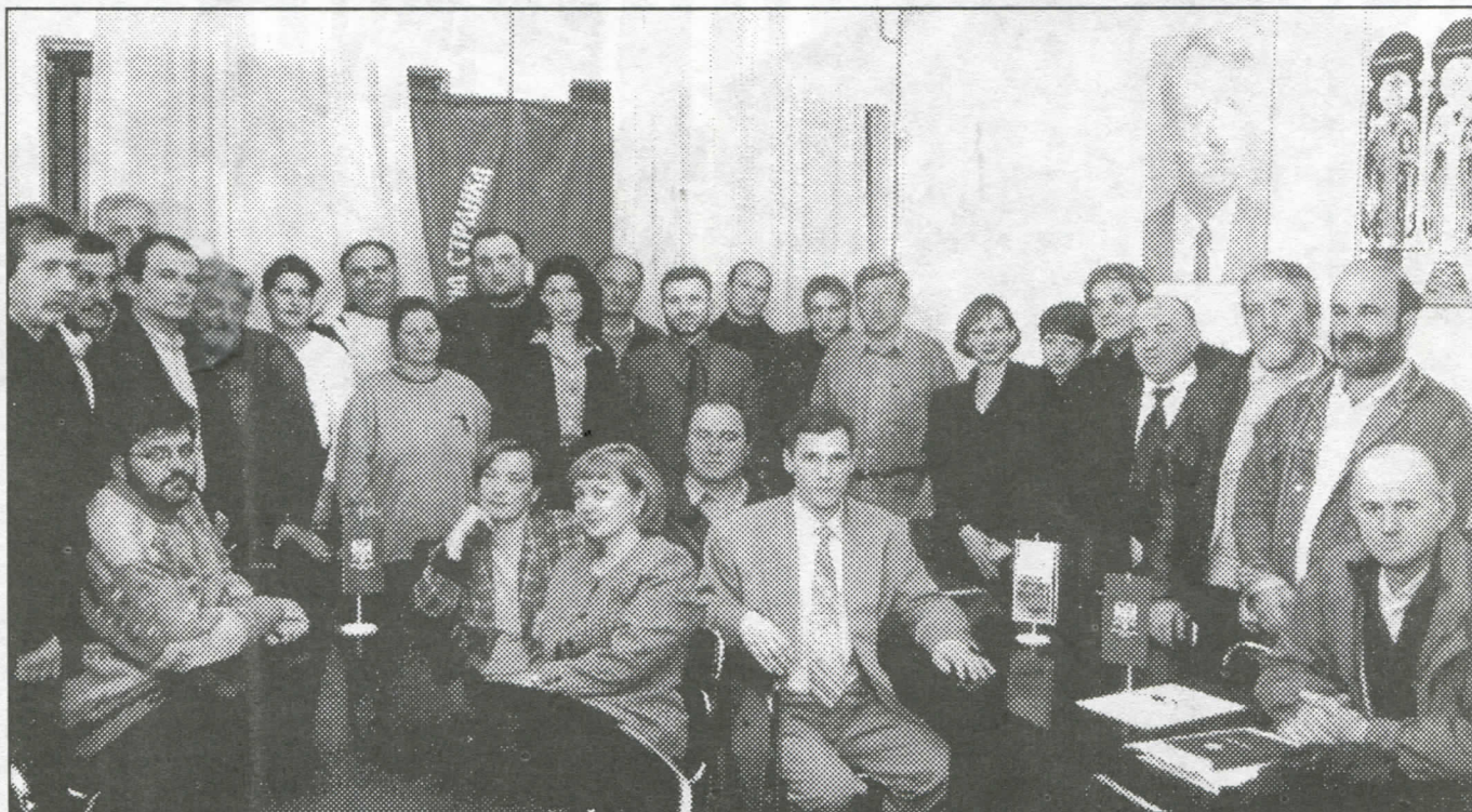
Општински одбор Српске радикалне странке Раковица