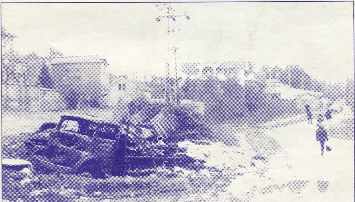
Дивља депонија: Вождовац зрео за радикалско велико спремање

Уклонићемо дивљу депонију у Белом потоку.