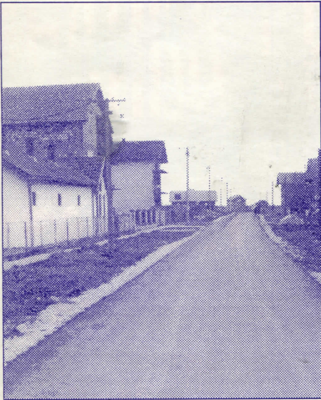
Један од приоритета: повезивање центра Белог потока са новоизграђеним путем од Зуца