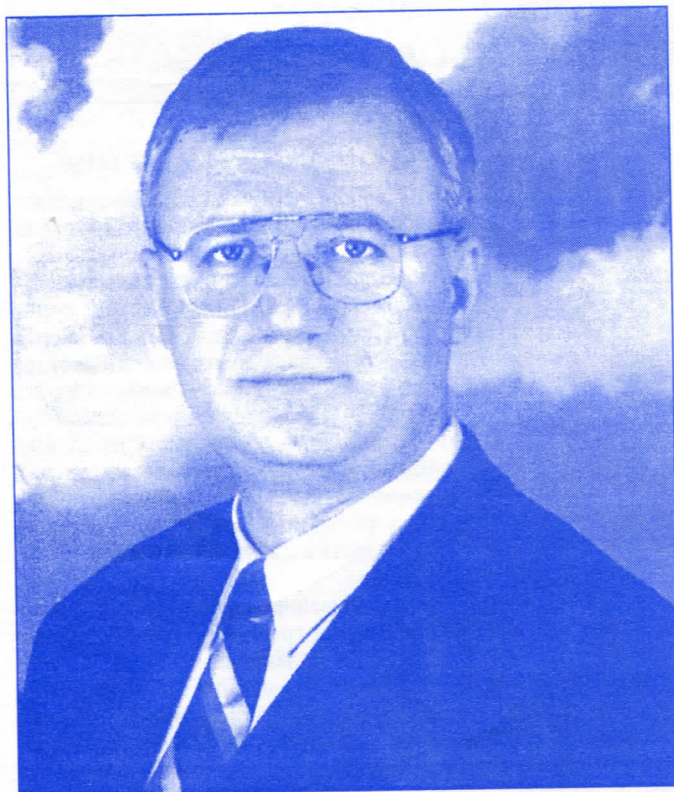
Председник Српске радикалне странке Др Војислав Шешелъ