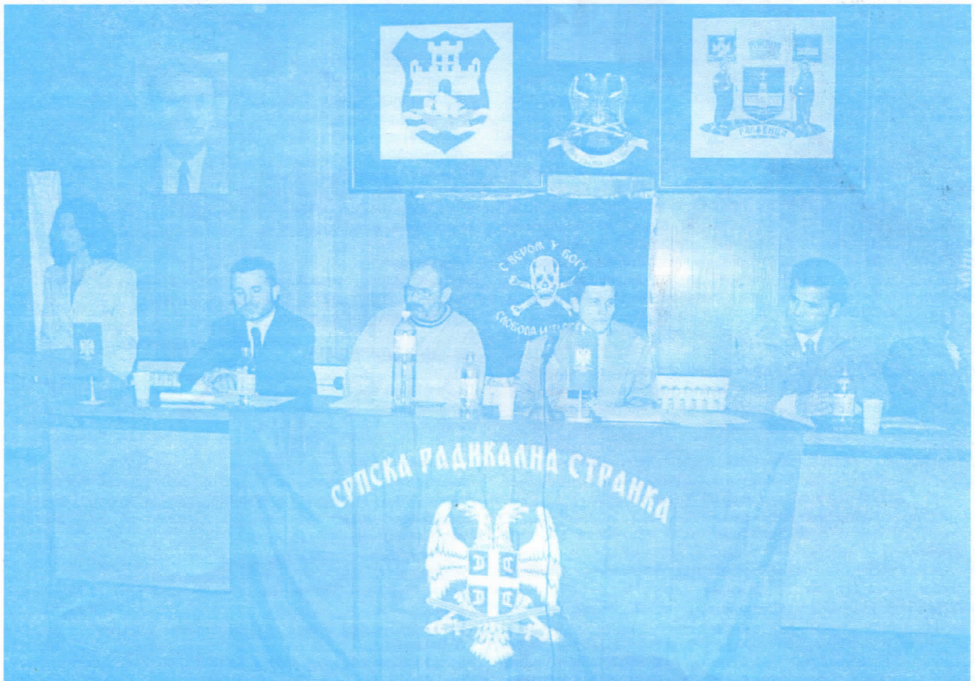
Руководство општинског одбора Раковица

-укинути финансирање листа из буџета општине а лист би прешао на режим самофинансирања. Тиме би се уштедела одређена материјална средства, а уредништво листа подстакло на тржишно понашање;