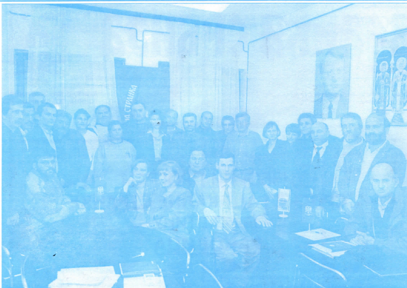
Чланови општинског одбора Раковица

неопходне рационализације у административном пословању, поједноставити све процедуре како би се што брже и ефикасније обављали сви послови. У самој општини постоји 30% вишка запослених. Став Српске радикалне странке је да нико не сме бити отпуштен, али зато ће радно време Општине бити продужено до 18 часова, свим данима сем недеље. Од радника ћемо захтевати максимални темпо рада и максимално залагање. Забранићемо свако напуштање радног места у току радног времена.