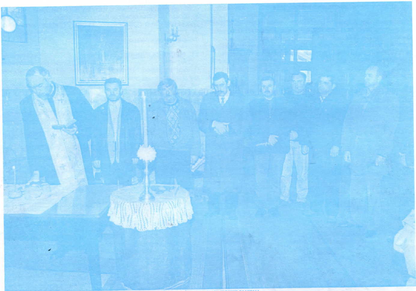
Света три Јерарха , слава српских радикала

физички хендикепирани грађани. Општина ће у том смислу да организује конкурс на који ће моћи да се јаве сви, уз само један услов, да имају регулисану пријаву боравка на територији Општине Раковица.