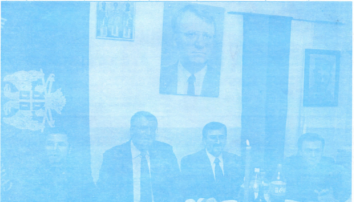
Председник Странке у Раковици

ниједан грађанин не сме вратити из општине необављеног посла и да се сви послови због којих грађанин долази у општину морају обавити у најкраћем року. Једини критеријум који ће важити у раду општинских служби је задовољан грађанин. Са тим у вези ћемо снимити постојеће стање и извршити све