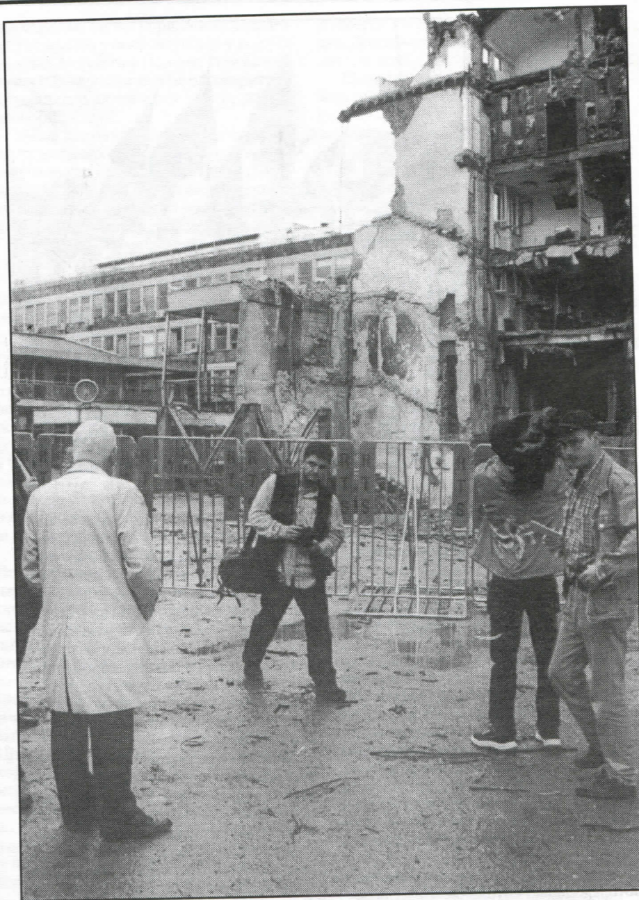
„Највеће злочине у двадесетом веку извршили су управо Американци“

Питао бих Вас сада какав је то поредак који није у стању да се бори чињеницама него мора да поруши предајнике и онемогући да се наша телевизија гледа. Они који се залажу за слободу штампе