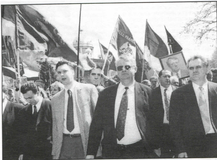
Увек са народом

● Неспорећи значај обнове земље, због чега се активности у обнови земље од НАТО агресије, користе у промоцију једне странке?