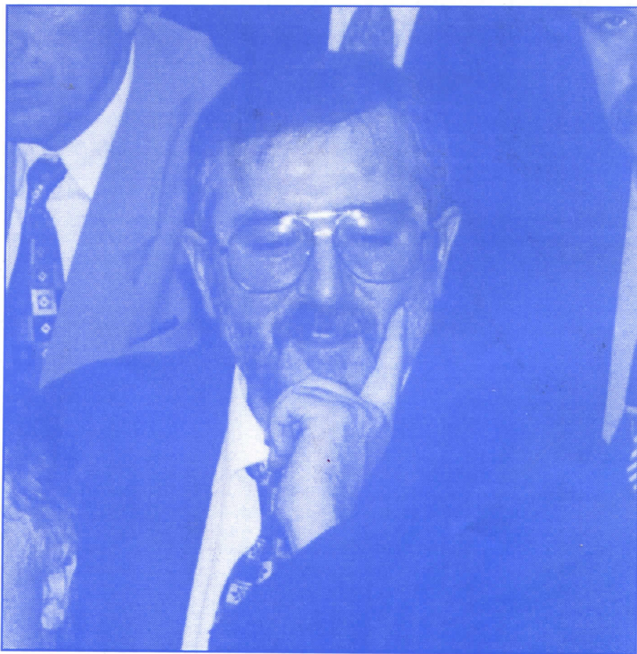
Драган Тодоровић: „Одговарам истином”

● Хвала Вам на учешћу у емисији „Хомополитикус”. Пред лицем јавности био је вечерас господин Драган Тодоровић, потпредседник републичке владе Србије. Гледаоцима хвала на пажњи и не мењајте канал.