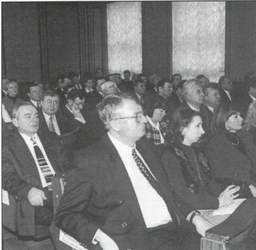
Радикали су упозоравали на последице доласка КФОР–а на Косово и Метохију