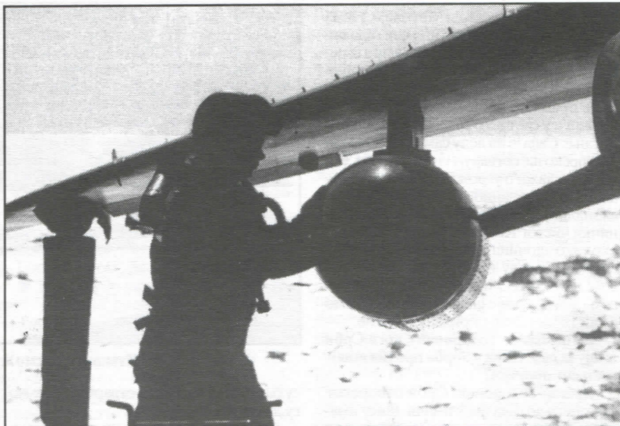
Припреме за нова убиства