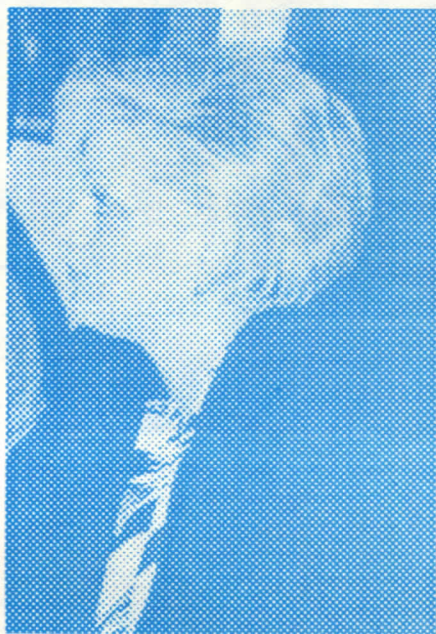
Јорђованка Табаковић, министар за економску и власничку трансформацију: Приватизација – једини пут за успешну ревитализацију привреде

Обнова Ваљева је започета још у току агресије, а након престанка рата одмах се кренуло са изградњом станова и приватних кућа за она домаћинства, којима су домови потпуно порушени. Такође се одмах пришло великом послу на санацији оштећених стамбених објеката, поправљани су кровови, столарија, преградни зидови, извршена су застакљивања огромног броја прозора, светларника, излога итд. Ови послови нису завршени, још увек су у току, али сваком домаћину ће се санирати штете у становима и кућама, које је „Демократски запад“ починио. Влада Републике Србије је као и по питању земљотреса, Ваљевском крају обезбедила максималну помоћ на свалађивању ових тешкоћа. Већина наших суграђана даје подршку огромном напору да се порушено поново доведе у ред, али има и једна група људи, која злурадо гледа на постигнуте успехе, па чак и навија да се ови озбиљни и одговорни послови не изврше, што говори о ниском моралу, а сигурни