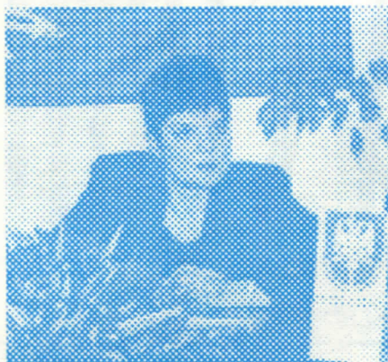
Маја Гојковић, потпредседник Савезне владе – ХРАБРОСТ НА ДЕЛУ

Окружног и Општинског одбора. Ово је доказ да Српска радикална странка никог не заборавља.