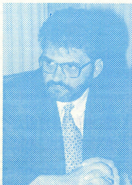
Зоран Крсинић, министар трговине у Влади Републике Србије: Здрава конкуренција при окупу малине, шљиве и других пољопривредних производа највише користи произвођачима