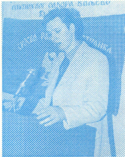
Александар Вучић, министар инфор- мисања у Влади Републике Србије – ЗАКОН О ИНФОРМИСАЊУ – ПРВА ОДБРАНА ОД АГРЕСИЈЕ