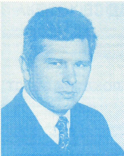
Драшко Панјић, председник Окружног одбора Колубарског окружа, народни посланик