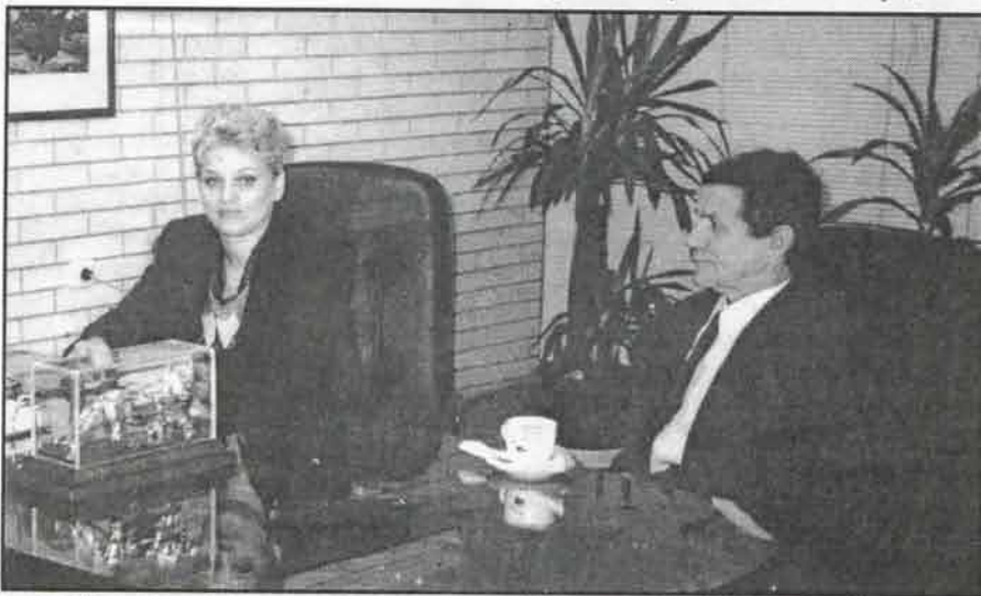
Министар за власничку трансформацију у Влади Србије Јоргованка Табаковић у студију телевизије "Палма Плус"