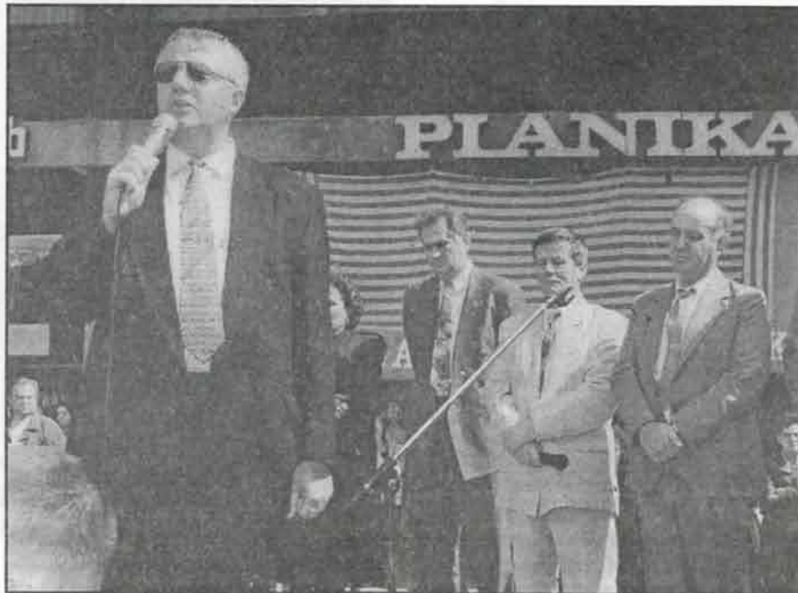
Др Војислав Шешелј на митингу у Ђуприји