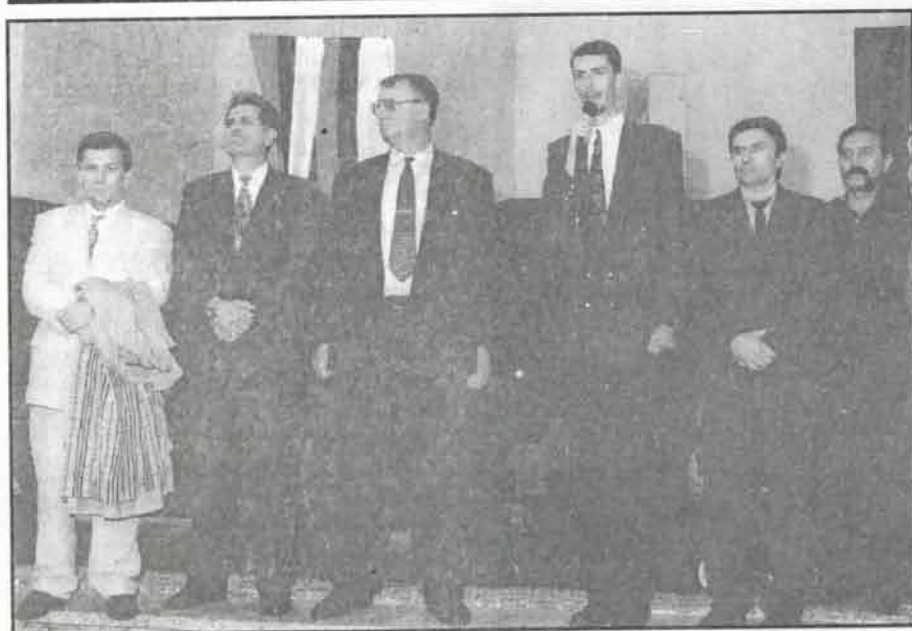
Српски радикали на митингу у Свилајци

скупштине међу коалиционим партнерима. Колико се сећам, изабрано је 5 судија Општинског суда у Јагодини, два заменика општинског тужиоца и четворо судија у Окружном суду. Не знам на које судије и тужиоце мислите.