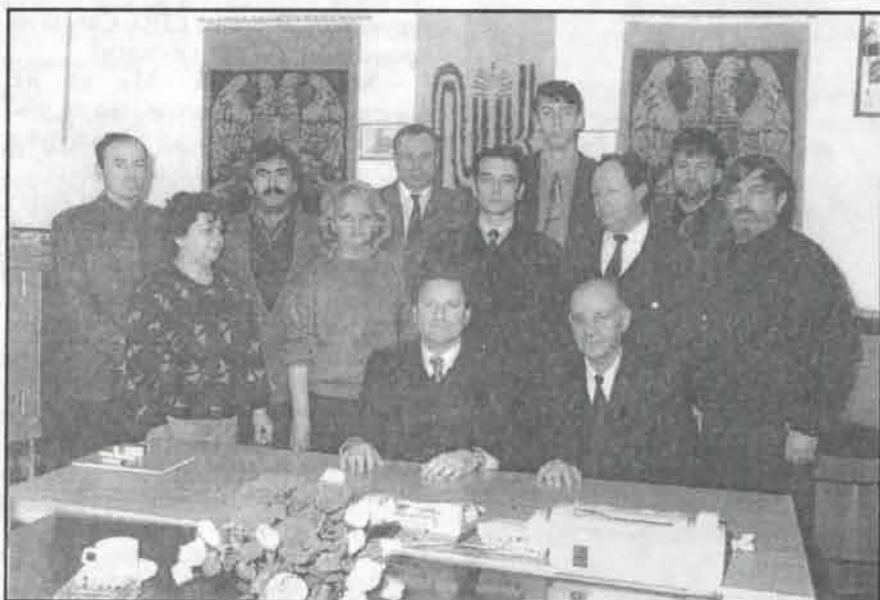
Чланови окружног одбора СРС Поморавског округа са министром правде у Савезној Влади Петром Јојићем