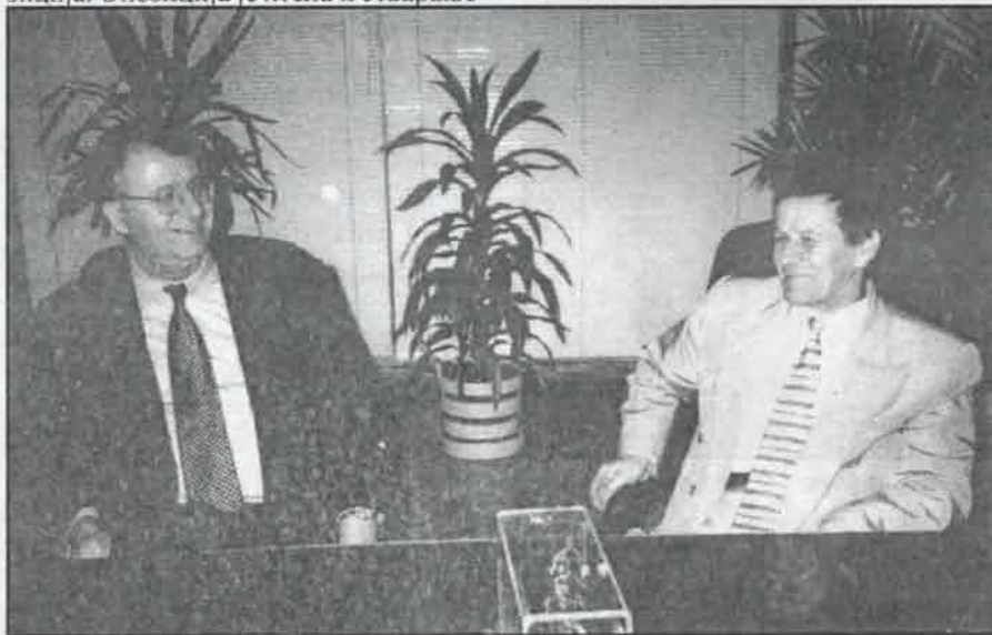
Потпредседник Владе Републике Србије др Војислав Шешел са министром за саобраћај и везе у Влади Републике Србије Ратком Марчетићем у студију телевизије "Палма Плус"

ВОДИТЕЉ: Очигледно је да имате добру скупштинску већину од 180 до 250 посланика, зато се и не жури, да тако кажем, на републичке изборе.