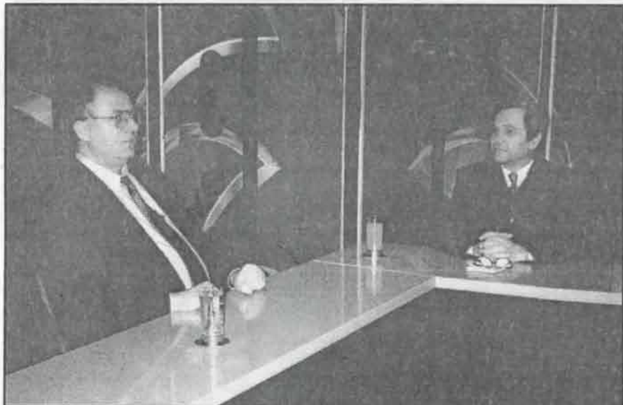
Потпредседник Владе Републике Србије др Војислав Шешел гост у студију телевизије "Палма Плус"

политичарима, јер њих 500 има забрану за излазак из земље. Јесте ли и Ви на том списку?