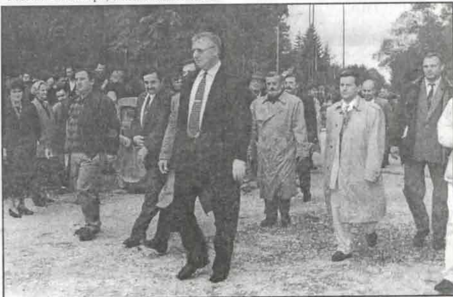
Српски радикали на митингу у Деспотовцу

ВОДИТЕЉ: Има питања поновозваних за изборе, каже плашите ли се