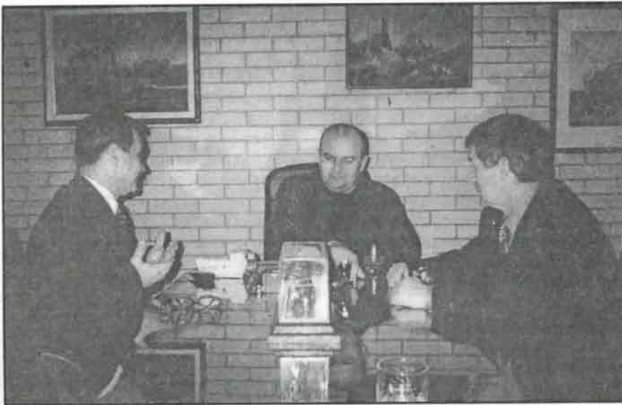
У студију ТВ "Палма Плус"

има много неизмирених обавеза према грађевинским фирмама и добављачима, као и по томе што се ангажују унутрашње резерве многих предузећа из Србије која добро послују, велики системи. Када се ради о Поморавском округу, односно Ћуприји, где су срушени стамбени објекти и спортска хала "Ада", вредност радова на њима износи: за два стамбена објекта у Карађорђевој улици 45 милиона, за 13 индивидуалних стамбених објеката 14 милиона, за спортску халу "Ада" 8,5 милиона динара, знате да је и наша кошаркашка репрезентација дала свој допринос за обнову хале.