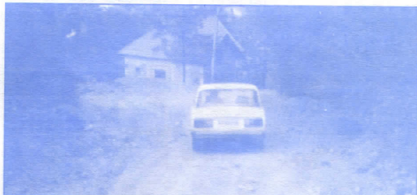
Практично непроходним путем сада се вози ауто