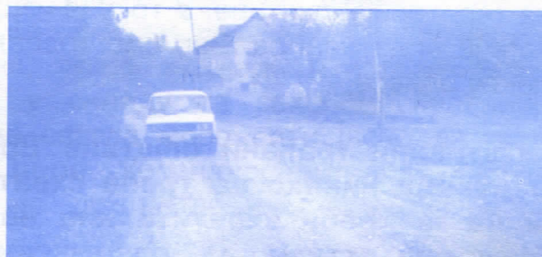
Асвалтираћемо до задње куће