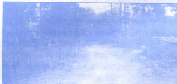
Изградња путева - ревитализација села