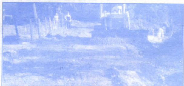
Пут се поново приводи намени