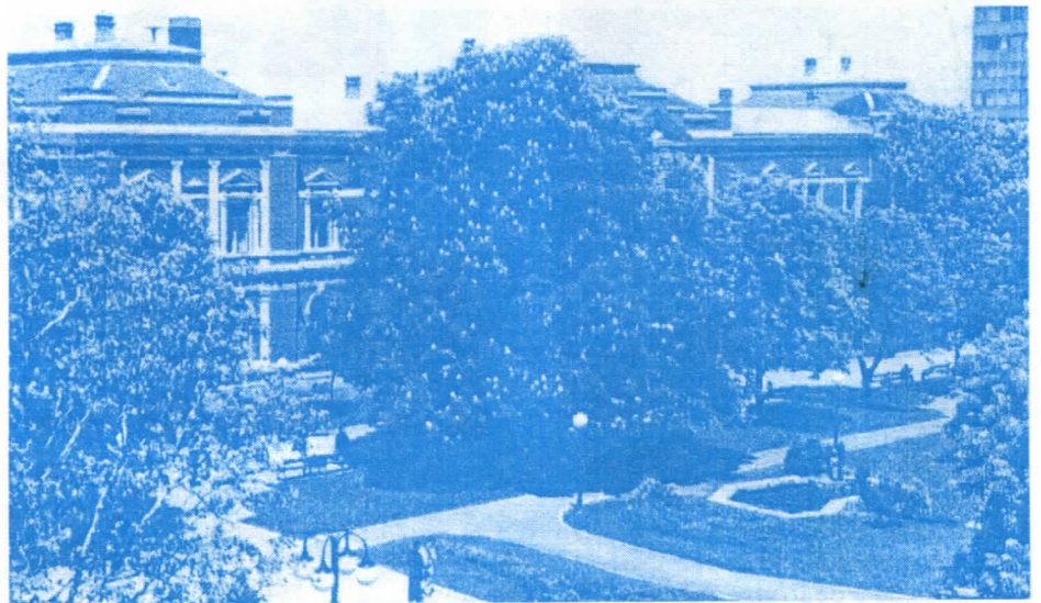
Зајечар - центар Тимочке крајине

Агресија НАТО пакта која је уследила од стране "најдемократскијих" и најразвијенијих држава у историји људске цивилизације јесте нанела жртве (и један изгубљен живот је ненадокнадив губитак) и огромно материјално разарање. Међутим, ако се има у виду количина и разорна моћ бомби и пројектила бачених на нашу земљу, намеће се закључак да агресор није постигао жељени ефекат. Зато српским Радикалима није јасно чиме су се руководили посланици СПС-а, ЈУЛ-а и СПО-а у Скупштини Србије када су прихватили тзв. мировни