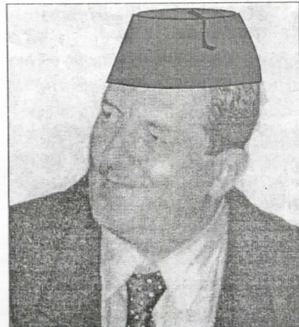
Одобрана јиројка за уништење Републике Српске и која би била јресрећна да у СР Југославији избије грађански рат

Фрање Туђмана и Алије Изетбеговића. После рата злоупотребили су процес демократизације и регистровали странке. Те странке данас представљају кључни фактор нестабилности и издаје Републике Српске.