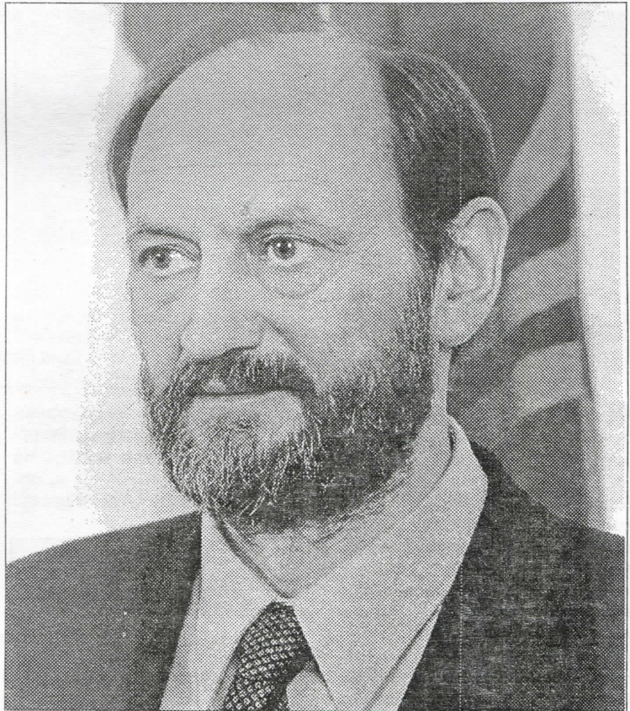
Председник Републике Српске Никола Поплашен

Председник марионетске и издајничке владе Милорад Додик, злоупотребавајући просјорије кабинетна и печат председника Владе Републике Српске, упутио је неформално писмо Министарству унутрашњих послова и Телеком-у Републике Српске. У писму изражи да Министарство унутрашњих послова обустави вршење обезбеђења председника Републике Српске Николе Поплашена и да га деложира из просјорија Кабинета председника Републике. Од Телеком-а је затражио да председнику Републике искључи шелефоне. Милорад Додик је близу тренутка када ће моћи да оде свом претходстављеном Алији Изетибеговићу и да му поднесе рапорти следећег садржаја: "Мој задатак је извршен, Република Српска не постоји"!