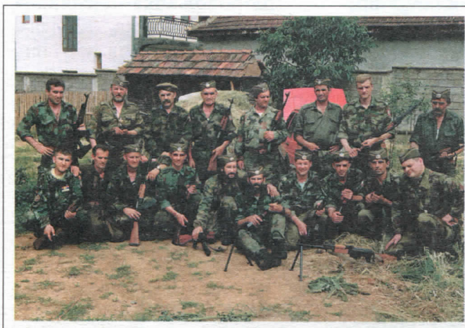
Добровољци СРС у Мејхохији, јуни 1999.