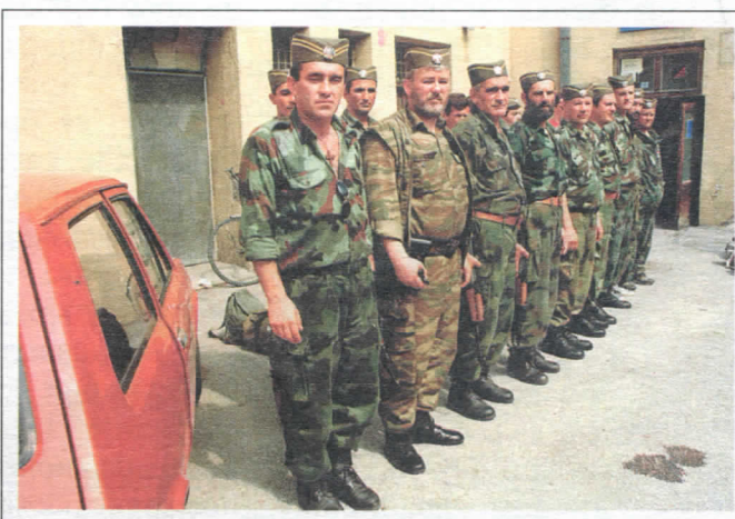
У стироју јунак до јунака, смойра пред полазак на положеј