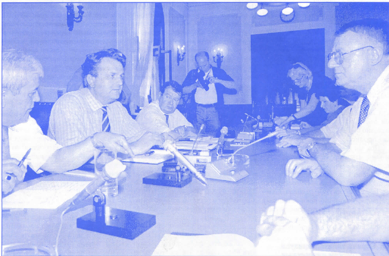
Др Шешел: „Нема сукоба између Србије и Црне Горе, постоје само сукоби међу олигархијама и међу монополима који се посебно преламају кроз економску сферу“

Да видимо, можда имамо неку такву личност, која би уживала елементарно поверење и једне и друге стране, пре свега на црногорској политичкој сцени, јер је она најзаоштренија. Можда постоји таква личност, која би могла да састави нову Савезну владу и у тој влади да партиципирају озбиљне политичке партије, у складу са овим принципима.