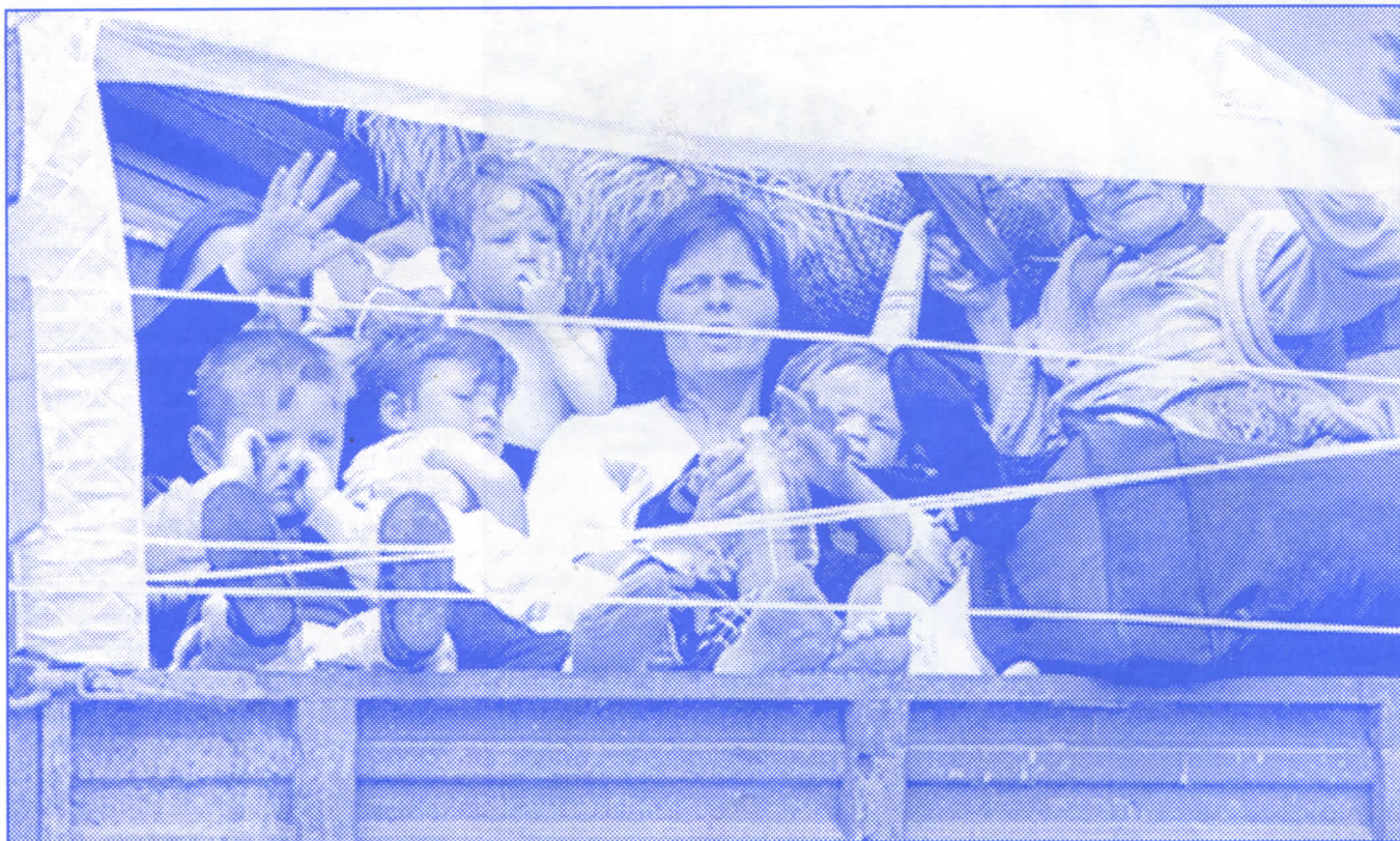
Протерани Срби беже с кућних прагова, враћају се и поново беже пред терором