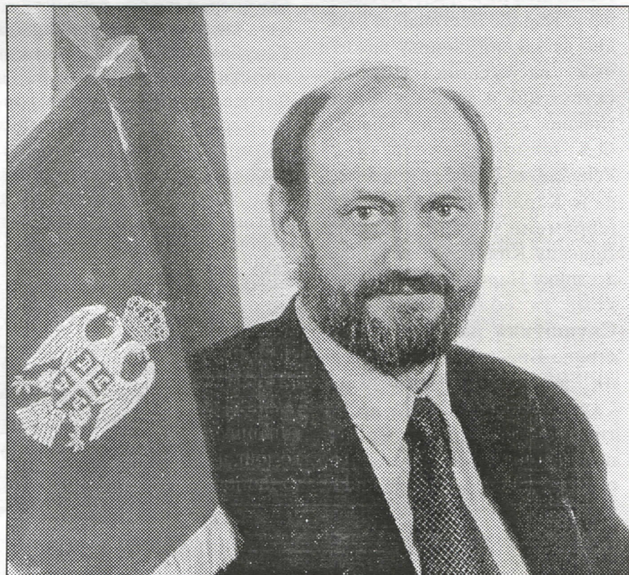
Никола Поплашен, председник Републике Српске кога је изабрао српски народ и предјесник Српске радикалне странке Републике Српске

закључак да се неће одржавати редовне седнице Скупштине док се не изабере нова влада. То је у суштини значило да влада Милорада Додика нема право да предлаже законе Народној скупштини и да ће Народна скупштина, уколико