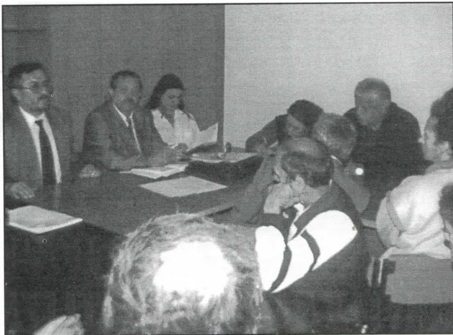
Српски радикали су ушли у Владу искључиво због предвиђања догађаја који нам се сада дешавају. Само захваљујући радикалима усвојене су мере које дају резултате

Тодоровић је, на питање гледаоца, објаснио разлоге уласка Српске радикалне странке у Владу националног јединства. „Основни разлог због чега је Српска радикална странка ушла у Владу националног јединства је управо предвиђање догађаја који ће уследити, и показало се да смо били сто посто у праву. Дали смо одређену чврстину Влади и спрове-