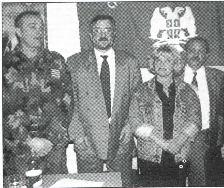
Чак и у овом ратном времену повећава се број чланова Српске радикалне странке