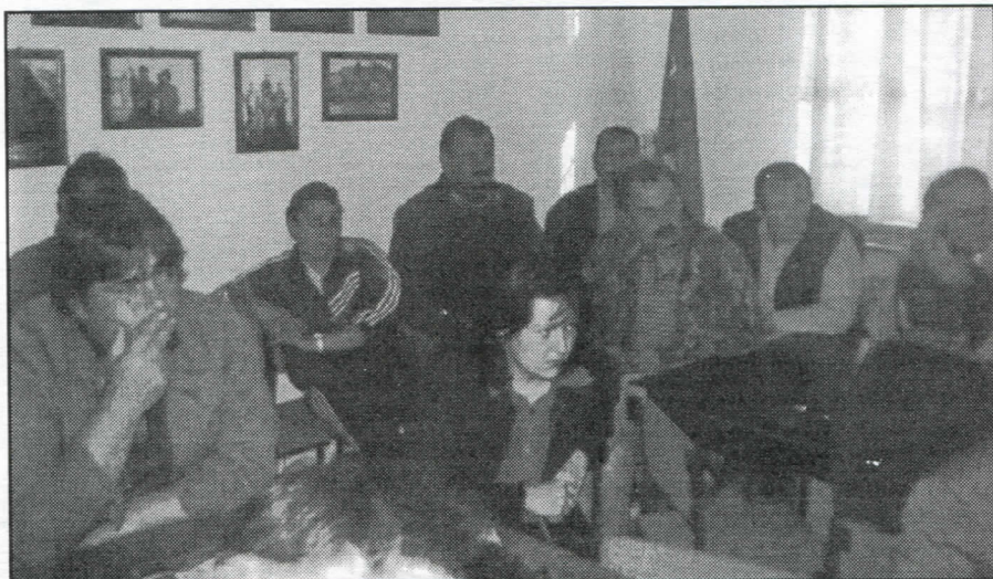
Српски радикали се никада у својој историји нису плашили провере народне воље путем регуларних избора