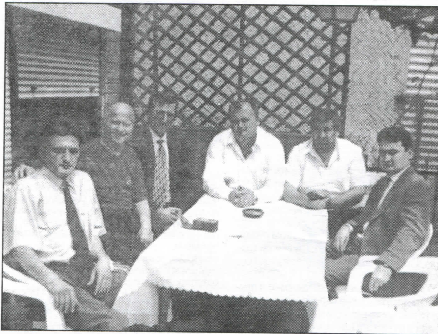
Радикали Пчињског округа састају се под ведрим небом зато што им је локална власт ускратила право на службене просторије

Сетимо се само колико је повике било на радикале због Закона о информисању, и колико се тај закон показао добар и неопходан. Том мером је спречена антидржавна пропаганда неких медија који су преносили програме страних те-