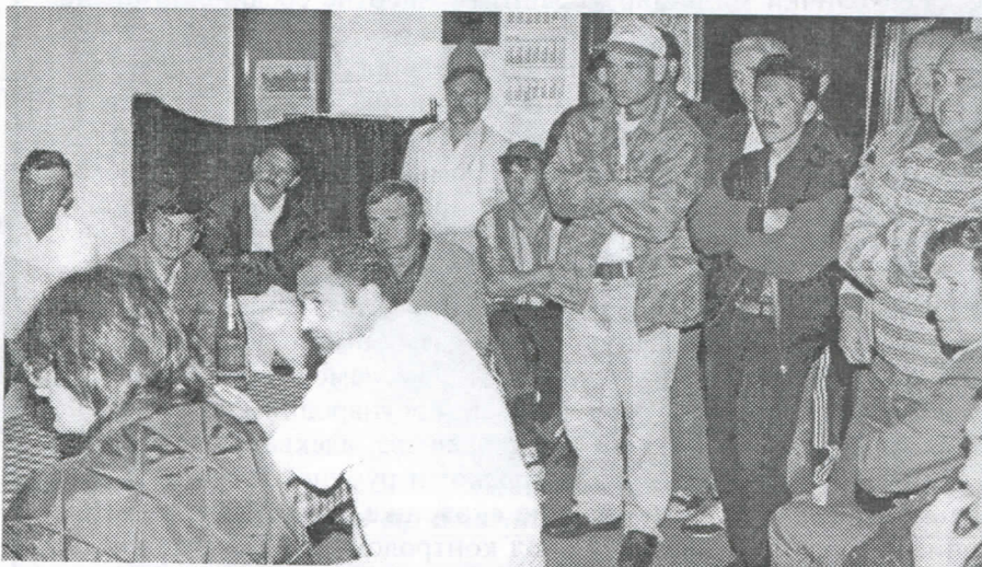
Челници Српске радикалне странке из општине Ада