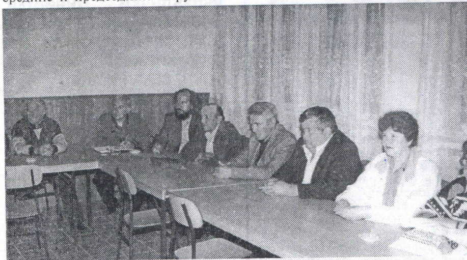
Чланови Општинског одбора СРС Нови Кнежевац

Од почетка 90-их година, од оснивања наше странке, један од основних циљева нам је остваривање националних права – да сами уређујемо своју државу и да не дозволимо да било ко отцепи неки њен део. Дакле, у нашој, сувереној држави, чији ћемо суверенитет и територијални ин-