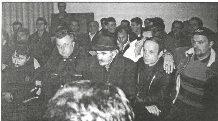
Општински одбор СРС Параћин

Др Шешељ: Па ја немам намеру тако да идем и обилазим фабрике и мислим да је то неки стари политички стил. Шта то значи доћи, још кад се обилазе те фабрике, па се организују свечани ручкови, па се држе говори, па се дају празна обећања, итд. Нама је циљ да нађемо пре свега погодно тржиште за