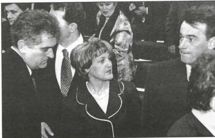
Влада Србије нема намеру да погази оно што је народ рекао на референдуму

веће порезе од оних који имају паре, а смањиваћемо онима који немају пара. То смо већ кренули у априлу месецу, мају, ако се сећате, смањили смо стопу пореза и доприноса на плате са 124% на