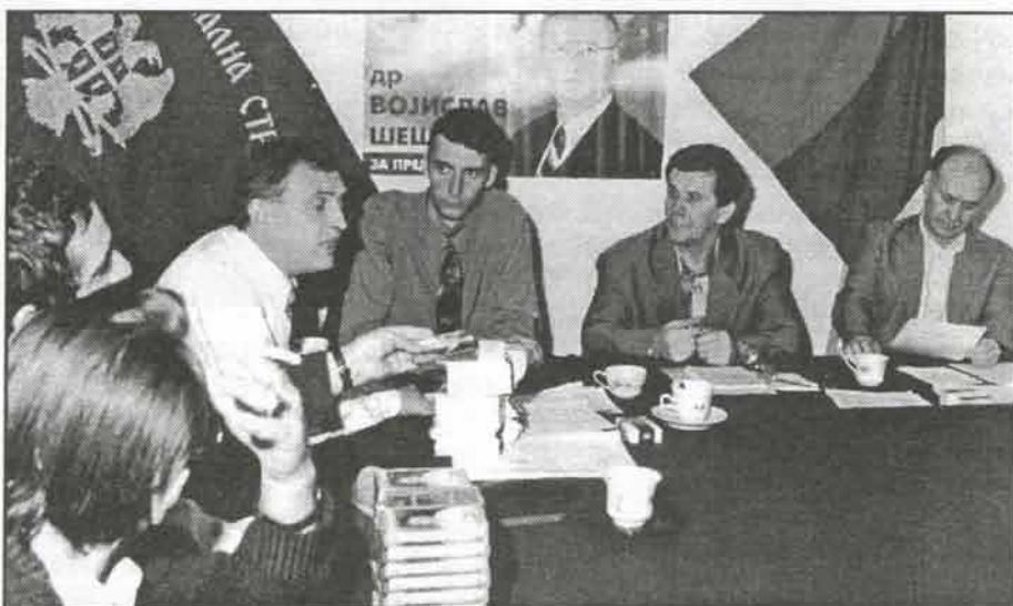
На седницама ОО СРС Поморавског Округа озбиљно се разматрају актуелни политички проблеми и стање у привреди округа