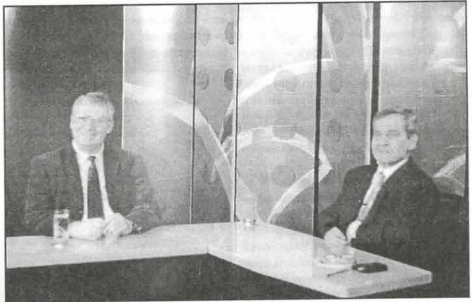
Др Шешељ у студију телевизије "Палма плус" у Јаџодини

рекли не попуштамо ни ако нас бомбардујете, и друго што је Русија тако одлучан и категоричан став заузела.