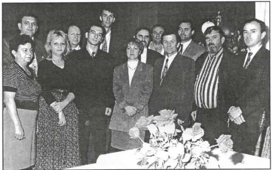
Окружни одбор СРС Поморавској округу

Др. Шешељ: То је сад проблем њихових татора, њихових ментора, Американаца, нека они решавају тај проблем. Ми смо непрекидно спремни на дијалог, дијалог о свим питањима, али постоји једно ограничење, дијалог се мора водити у границама Устава Србије, нико нема право да гази тај Устав, и један наш представник, представник Владе Србије неће смети да гази тај Устав или да иде мимо Устава. А идеје могу разноврзне да се износе.