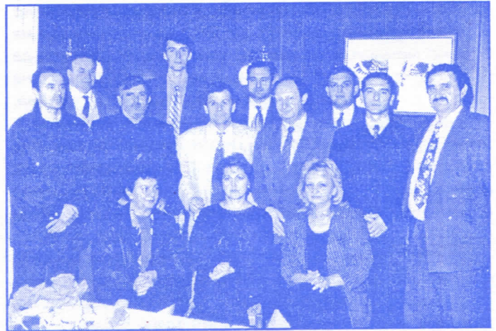
Чланови Окружног одбора СРС Поморавског Округа са министром за локалну самоуправу у Влади Србије Горданом Поп Лaziћ