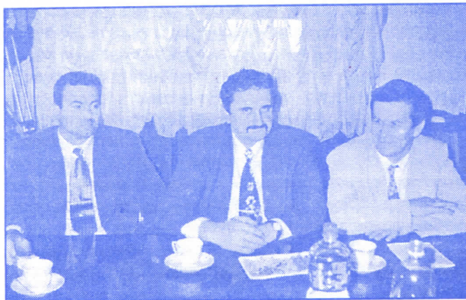
Народни посланици у Скупштини Републике Србије из Поморавског округа