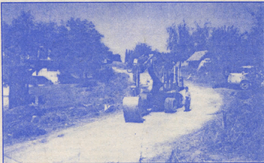
Градилиште пута Теслић - Станари - Добој

А сада да покушам одговорити на ваше питање. Тврдим одговорно да међународна заједница према Теслићу не проводи никакве мјере изолације и то је чиста измишљотина и злоупотреба оних којима смета оваква наша политика. Откуда изолација ако сам за неколико мјесеци мога мандата са међународним организацијама склопио низ уговора о улагању у инфраструктурне објекте у укупној вриједности од преко два милиона ДМ. Уговорена је реализација укупно 22 оваква програма, међу којима издвајам само неке: изградња мостова на путу према Блатници, реновирање радионица Средњошколског центра, изградња теренских амбуланти у Очаушу, Криваји и Прибинићу, поште у