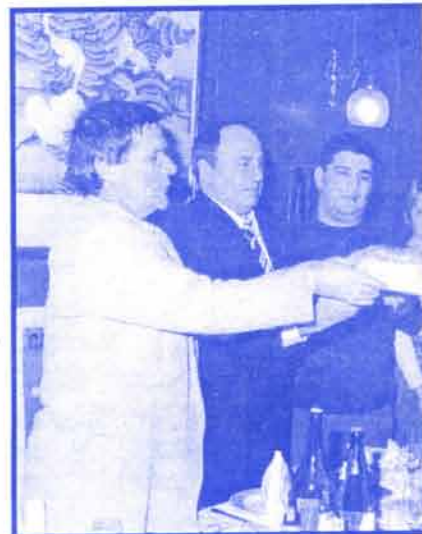
У седишту СРС у Ђуприји прослава Св. Три Јерарха 12.02.1998. Св