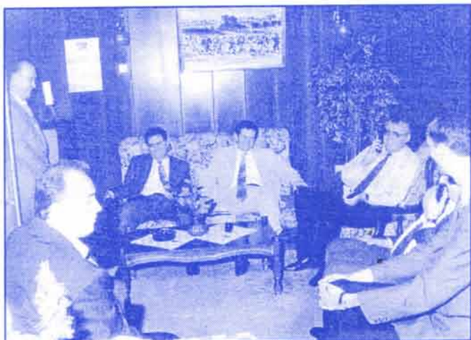
У Пословном клубу компаније "Марчевић" у Ћуџирију, септембар 1996. године

Водитељ: А ви захтевате, ако се не варам, да се на скупштини поведе питање једне од неуралгичних тачака овде, а то је Косово.