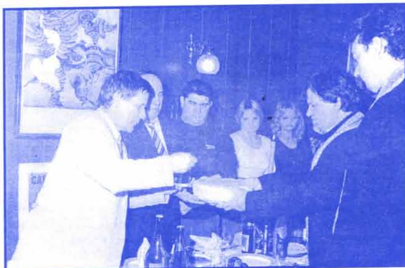
Сечење колача поводом страначке славе Св. Три Јерарха 12.02.1998. у Ђуприји