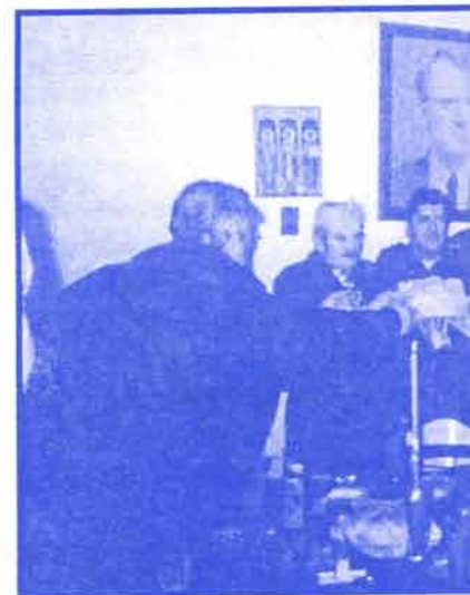
Свечани обред чинодејства у цркви Св. Тројице