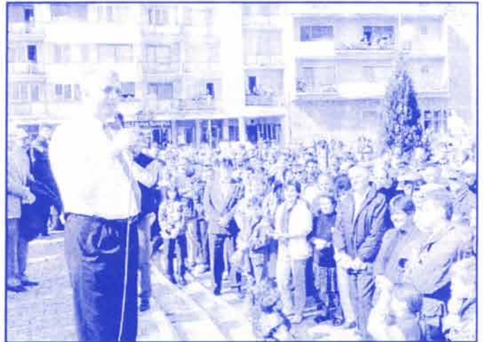
Др. Војислав Шешељ говори на митингу у Параћину 15.09.1996. године

др Шешељ: Да. Те плакате је штампала Демократска странка. Њихови активисти су то лепили не само по Београду, и још по неким градовима у унутрашњости Србије, где још имају своје општинске одборе. И морам признати да си ми ти плакати били веома смешни. Прво, кад једна политичка партија тражи од друге политичке партије да се понаша онако како она прва жели, то је само по себи смешно. Па није наш мотив бављења политиком да удовољимо демократској странци, чак и да је то нека њена изворна жеља. А друго, зашто Демократска странка није изашла на изборе, освојила одређен број посланичких мандата и онда опет правила коалицију са Вуком Драшковићем? И треће, наважније, срамота је да та Демократска странка која је више пута улазила у коалицију са Српским покретом обнове и Вуком Драшковићем, и сваки пут била разочарана, дакле више су пута јели оне ствари које нормални људи не једу, па им се то огадило, рекли неће више никад, али нас сада терају да ми то бар једном пробамо. Али ми нећемо. Знате, да су нормалније прилике сас-