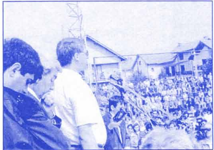
Др. Војислав Шешељ први пут у Ђурију септембра 1991. год.