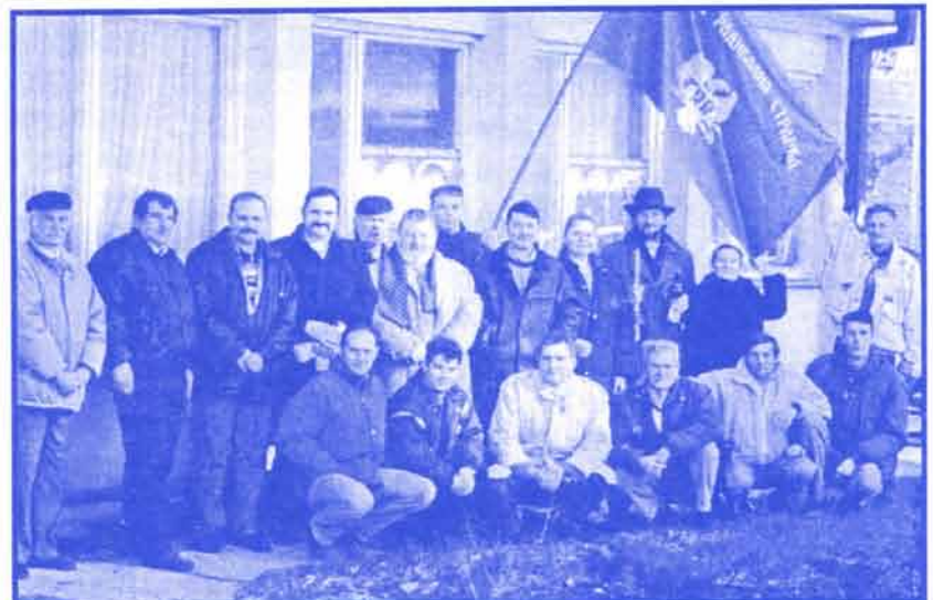
Јагодински радикали пред страначким просторијама прослављају страначку славу Св. Три Јерарха