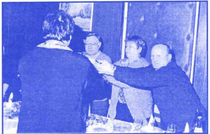
Детаљ са прославе страначке славе у Ђуприји