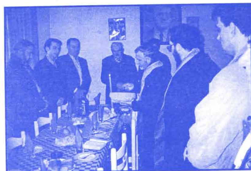
Прослава славе СРС Св. Три Јерарха у клубу ОО СРС Параћин