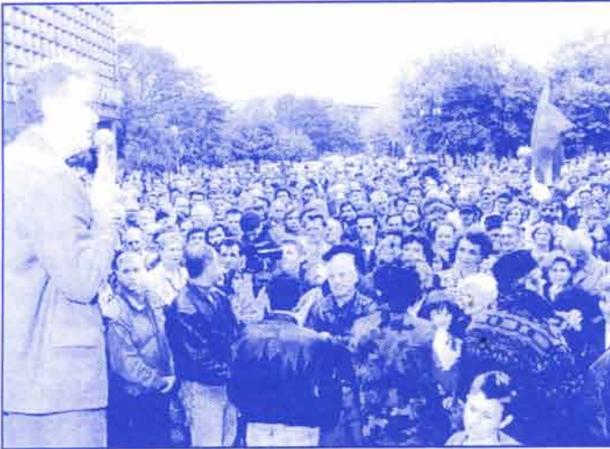
Томислав Николић на миџинџу у Тузлу 15.09.1996. године