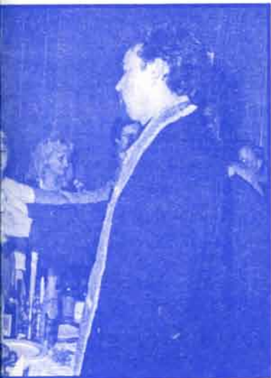
Њена је слава српских радикала Три Јерарха