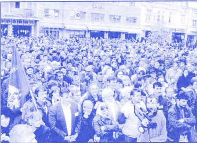
Миџинџ у Јаџодини 20.10.1996. љодине