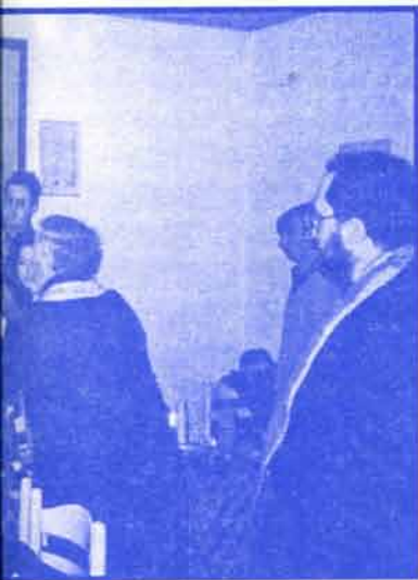
Говорили су свештеници у Параћину