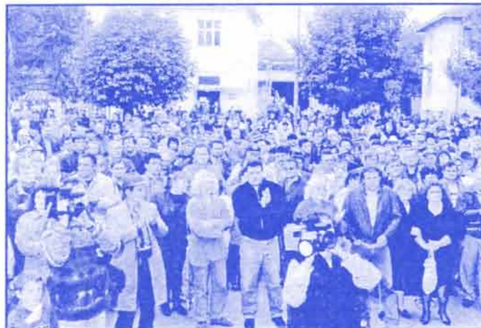
Дешаљ са мишинга у Деспишовцу 15.09.1996. године

др Шешељ: Није она оснажила динар, знате, ту су два процеса у току. Прво, садашња власт манипулише динаром и курсним разликама, и они су то увек радили, они су махери у томе. Како? Прво су послали државне дилере на улицу, да купују што више девиза од народа, изашли су са неком већом количином динара, и обезвредили динар. Створили су панику људи који су имали динаре уплашили су се, и пожурили да те своје динаре претворе у марке. Дакле, после ових државних дилера са динарима појавили су се државни дилери са девизама и непрекидно дизали цену марке. Грађани који су