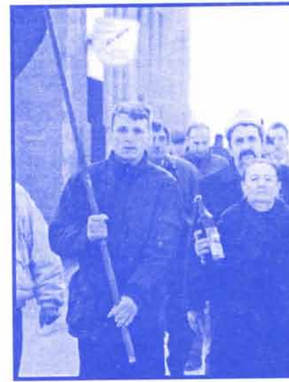
На путу до цркве јагодински радикали