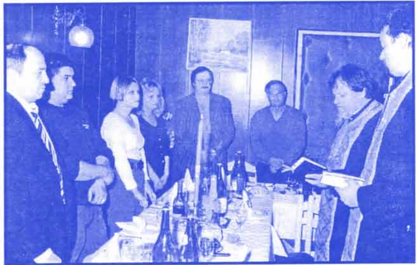
Свечани обред поводом страначке славе