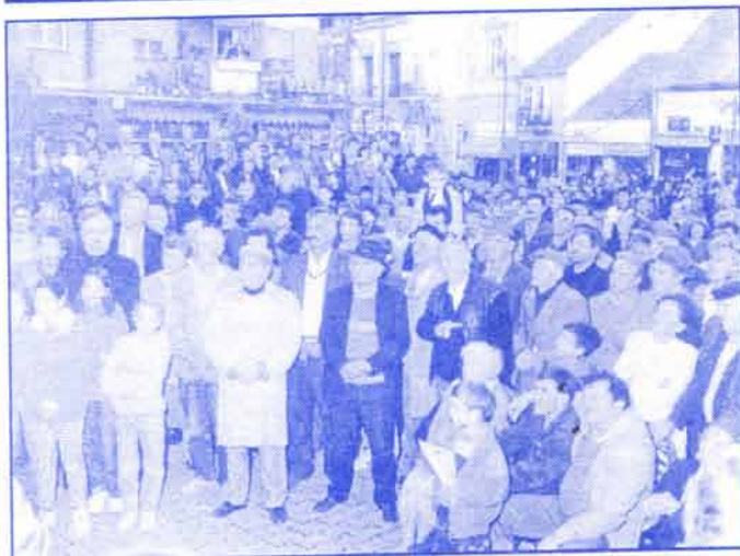
Дешаљ са митинга у Свилајнцу 15.09.1996. године