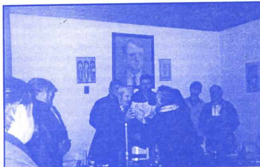
12.02.1998. Слава српских радикала Света Три Јерарха