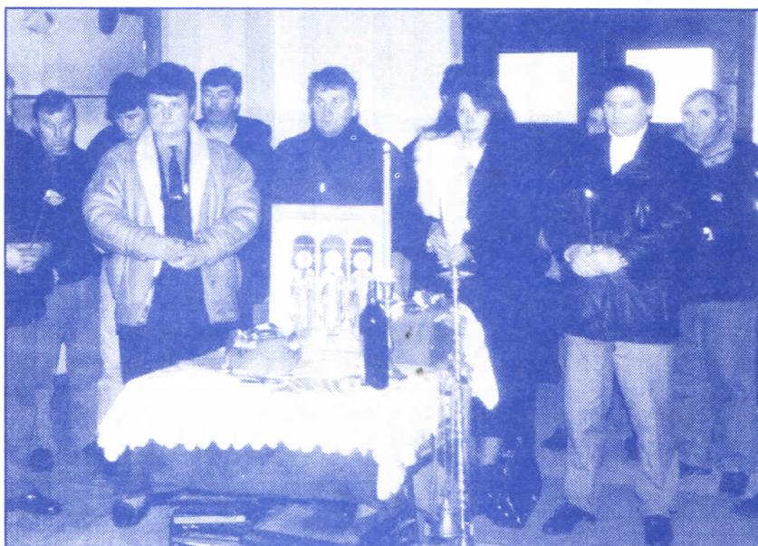
ДЕТАЉ СА СВЕЧАНЕ ЗАКЛЕТВЕ