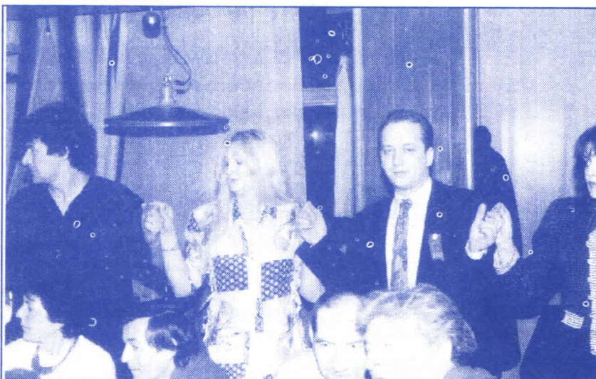
ИГРАЛО СЕ И ГОСТИЛО ДО КАСНО ИЗА ПОНОЋИ