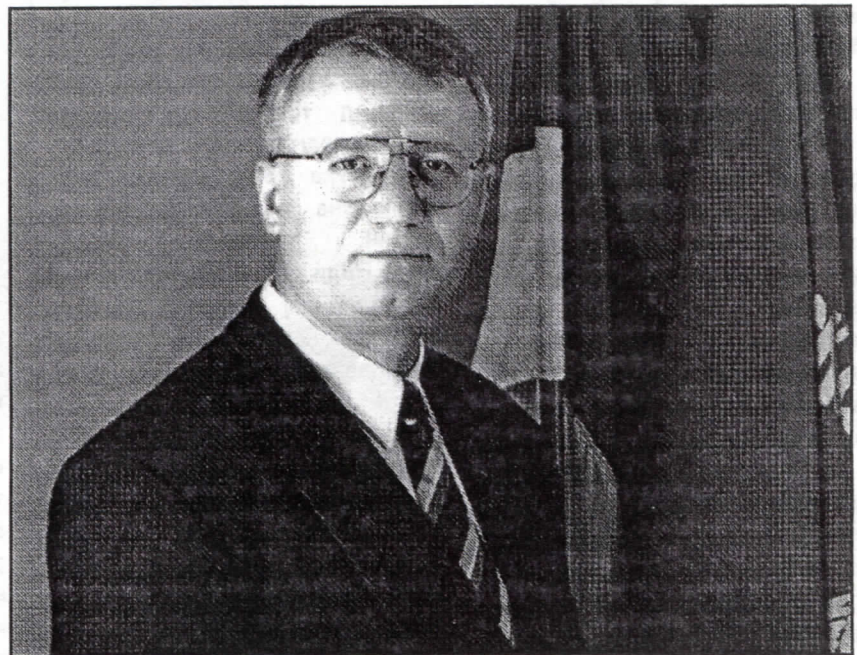
др Војислав Шешељ - жртва дрске изборне крађе

Избори почев од 21. септембра па до 21. децембра прошле године показали су да владајућа странка у Србији користи три паралелна