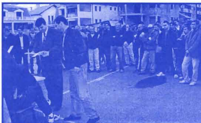
Детаљ са састанка са члановима бирачких одбора СРС Парафин одржаног на игралишту МЗ Глождак због забране коришћења просторије.