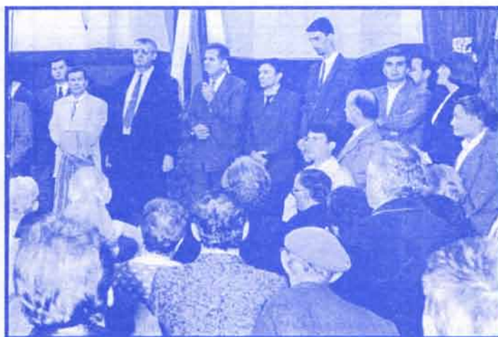
Детаљ са митинга у Свилајнцу