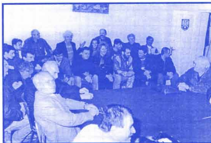
Детаљ са састанка са члановима бирачких одбора

Председнички кандидат СРС др Војислав Шешељ у општини Ђуприја рекордне победе остварио је у селу Вирине, где је од 588 гласача добио 353 гласа, или 60.03%, затим у граду Ђуприји где је од 10277 изашлих освојио 5812 гласа, односно 56.55%, и у Мијатовцу где је од 997 гласача добио 561 глас, или 56.26%.