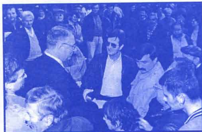
Др Војислав Шешел у Параћину