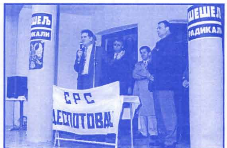
Детаљ са митинга у Деспотовцу

У општини Деспотовац др Војислав Шешељ убедљиво је победио противкандидата Зорана Лилића у Буковцу где је од 317 гласача добио 199 гласова, тј. 62.77%, затим у Грабовици, где је од 500 изашлих освојио 311 гласова, тј. 62.20% и у Балајнцу где је од 356 гласача добио 218 гласова, што је 61.23%