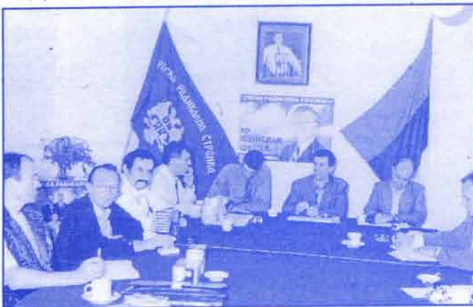
Дешаљ са седнице Окружног одбора СРС Поморавског округа