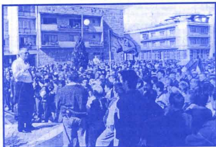
Митинг СРС у Параћину

Др Војислав Шешел, у општини Параћин, најбоље резултате остварио је у Стрижи, где је од 699, добио 557 гласова, тј. 79.68%, затим у селу Забрега где је од изашлих 341, освојио 254 гласа, што представља 74.48%, као и у Лешју где је од 227 гласова добио 163 гласа, односно 71.80%