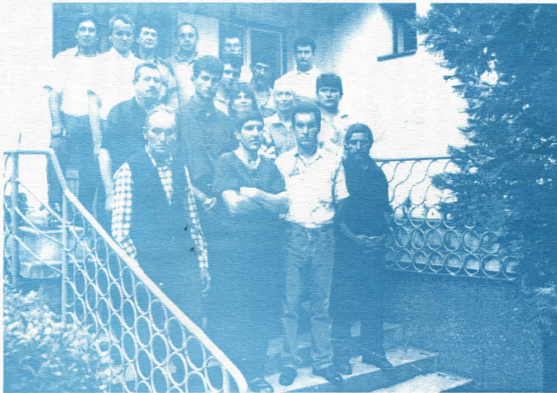
Део руководства општинског одбора Српске Радикалне странке у Гаџином Хану