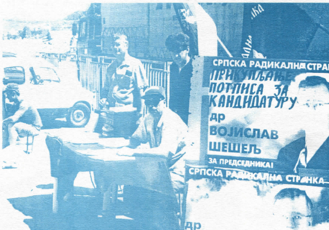
Детаљ са сакупљања потписа за кандидатуру Др Војислава Шешеља