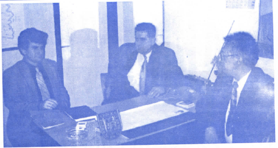
Томислав Николић у разговору са кандидатима СРС за републички парламент

Народ је огорчен а и ми Српски радикали јер смо му пре почетка емисије поклонили две траке са