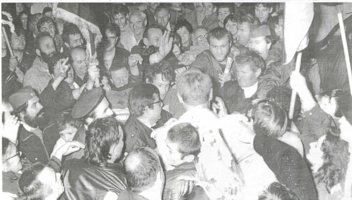
Председник са Сомборцима

СОМБОР, фебруар 1997., ГОДИНА VIII, број 352