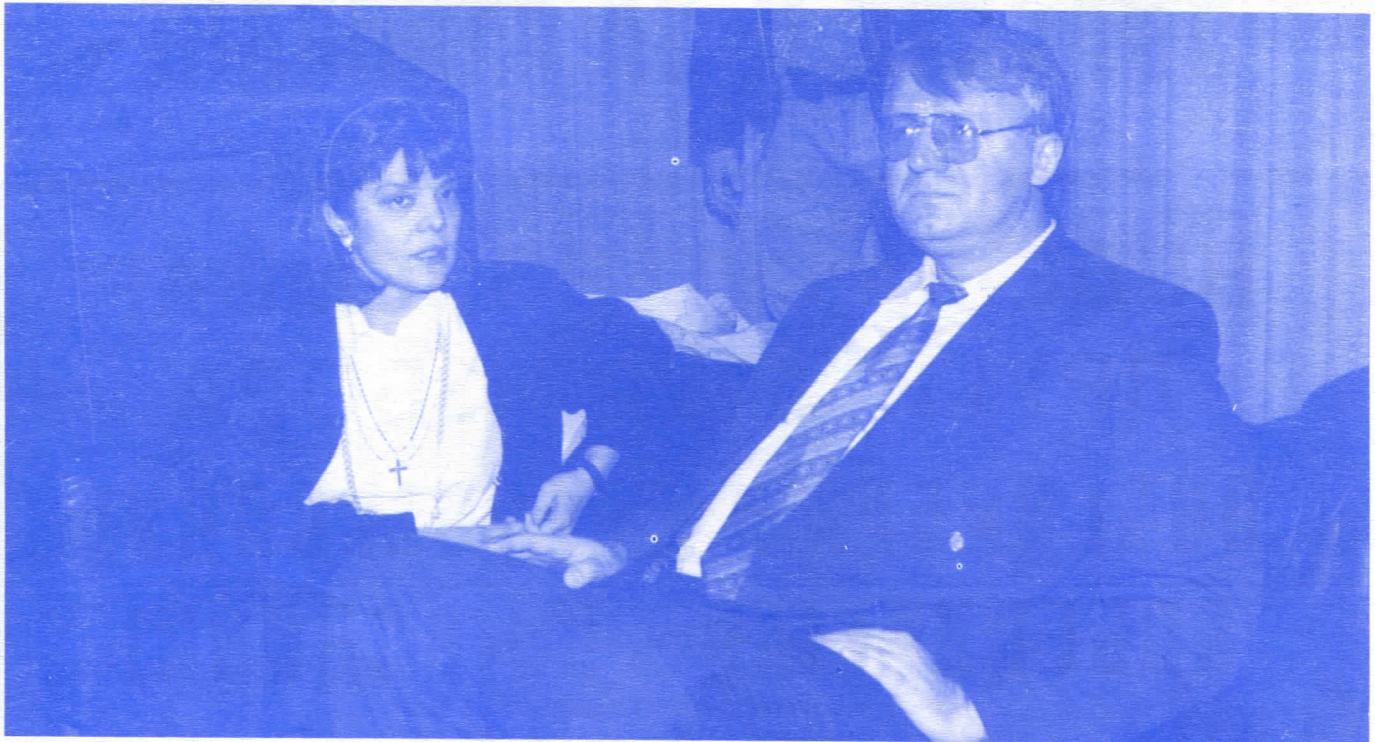
Победићемо: Др Војислав Шешел и Маја Гојковић

и територијалне целовитости српске државе, као ни стварање аутономних области, које би у блиској будућности обезбедиле прерогативе државне власти. Српска радикална странка, поштујући српску традицију, сматра да права националних мањина морају бити загарантована у складу са највишим европским стандардима, а заштита права и слобода сваког појединца представља један од показатеља стварног поштовања принципа равноправности и једнакости грађана. Сви они који признају српску државу имали би апсолутно иста права и дужности без обзира на националну или верску различитост.