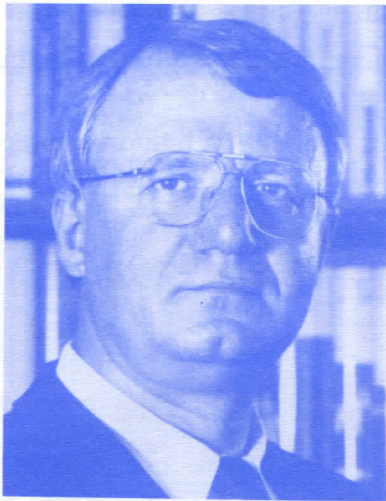
ДР ВОЈИСЛАВ ШЕШЕЉ