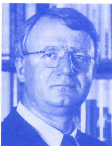
ДР ВОЈИСЛАВ ШЕШЕЉ