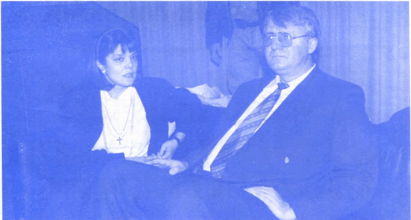
Победићемо: Др Војислав Шешел и Маја Гојковић

и територијалне целовитости српске државе, као ни стварање аутономних области, које би у блиској будућности обезбедиле прерогативе државне власти. Српска радикална странка, поштујући српску традицију, сматра да права националних мањина морају бити загарантована у складу са највишим европским стандардима, а заштита права и слобода сваког појединца представља један од показатеља стварног поштовања принципа равноправности и једнакости грађана. Сви они који признају српску државу имали би апсолутно иста права и дужности без обзира на националну или верску различитост.