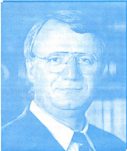
др Војислав Шешелъ носилац свих изборних листа Српске радикалне странке

КУЛА, ОКТОБАР, 1996, ГОДИНА VII, БРОЈ 232 ИЗЛАЗИ МЕСЕЧНО, БЕСПЛАТАН ПРИМЕРАК