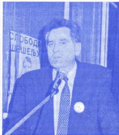
Томислав Николић – човек који зна како се треба супротставити махинацијама социјалиста и њихових саучесника.

Живот сам посветио борби за бољу, богатију и лепшу Србију, за Србију у којој ће на власти бити Срби, за Србију без лопова, превараната, издајника, за Србију без комуниста. Припадам групи поносних и честитих људи којима је српство важније од материјалног благостања, који не продају веру за вечеру. Припадам српским националистима и поносан сам на своју странку, Српску радикалну странку. Нама љубав према српству извире из срца и одређује нам живот. Ми не одустајемо пред препрекама, нас не могу да заплаше, уцене, купе.