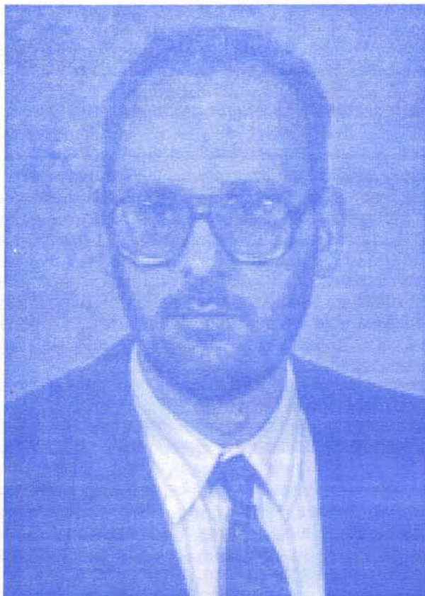
Мирослав Васиљевић дип. политиколог републички посланик стар 40 година