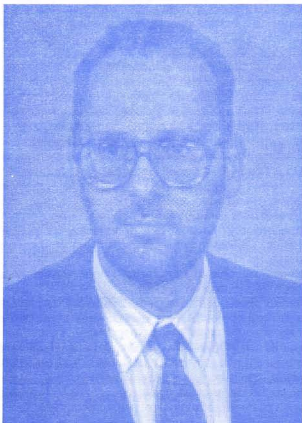
Мирослав Васиљевић дип. политиколог републички посланик стар 40 година