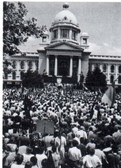
МИТИНГ СРПСКЕ РАДИКАЛНЕ СТРАНКЕ ИСПРЕД САВЕЗНЕ СКУПШТИНЕ

- Нама радикалима се врло често подмеће како смо против припадника