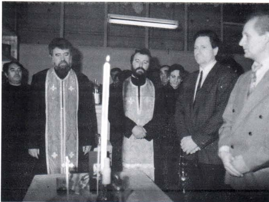
СЛАВА СРПСКИХ РАДИКАЛА ТРИ ЈЕРАРХА

- Таква изрека је последица наслеђа које су нам оставили лоши и неморални политичари. За нас, Српске радикале, образ нема цену. Морал није на продају. Не једном смо доказали да се не плашимо ни репресије, ни затвора, ни робијања. Показали смо небројано пута да не правимо труле компромисе, да смо доследни, отворени и да радимо јавно. То је права демократија, а не данас једна, а